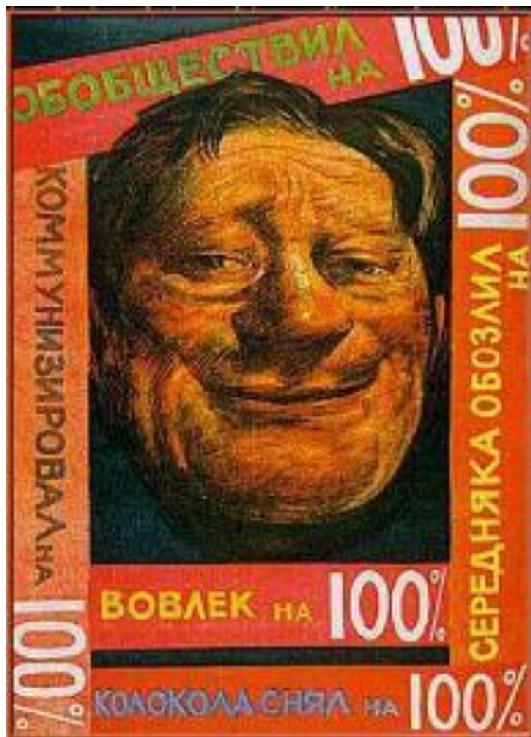
Карикатура 1929 г. Головоотяп на 100%.

Весной 1930 г. стало ясно, что коллективизация грозит катастрофой. 2 марта Сталин опубликовал статью «Головокружение от успехов», в которой обвинил в неудачах местных руководителей и осудил «перегибы». В ответ начался массовый выход крестьян из колхозов.