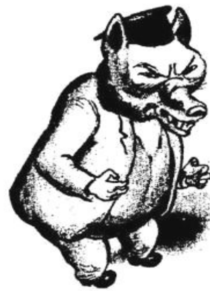
2. Кулак в колхозе

Ликвидация кулачества имела своей целью обеспечение колхозов материальной базой. В 1-й половине 1930 г. Было раскулачено 320 тыс крестьянских хозяйств. Их имущество отошло к колхозам. Все кулаки делились на 3 категории-те кто боролся с Советской властью подлежали расстрелу, наиболее богатые выселялись в отдаленные территории СССР, а остальные расселялись на участках за пределами колхозных земель.