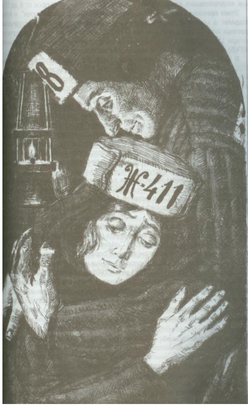
Рисунки художника К. Иванова