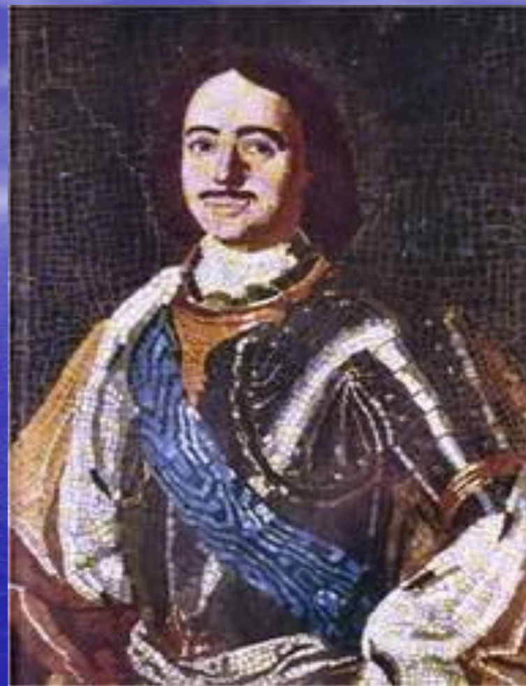
Петр Первый. Мозаика работы М.В. Ломоносова