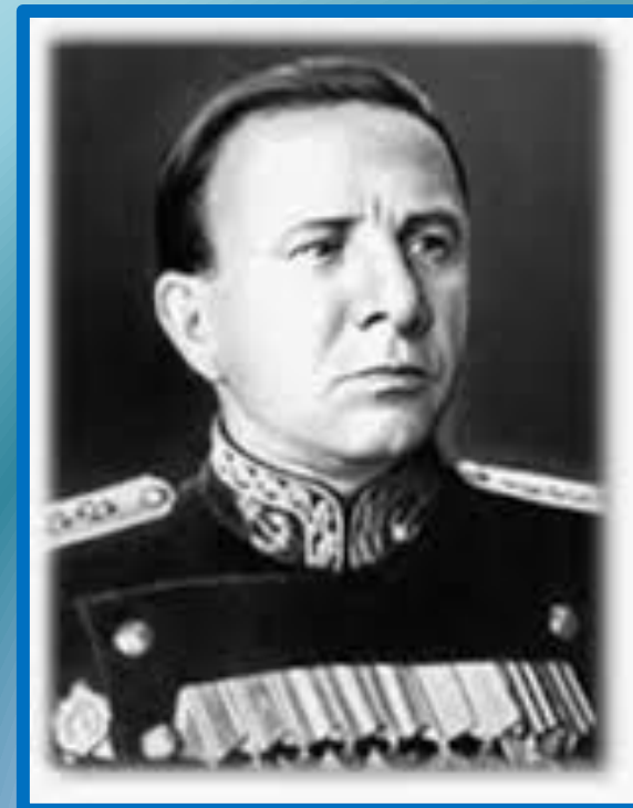
Вице-адмирал В.Ф. Трибуц

В таллинском переходе шёл как флагман отряда главных сил (командующий — вице-адмирал В. Ф. Трибуц).