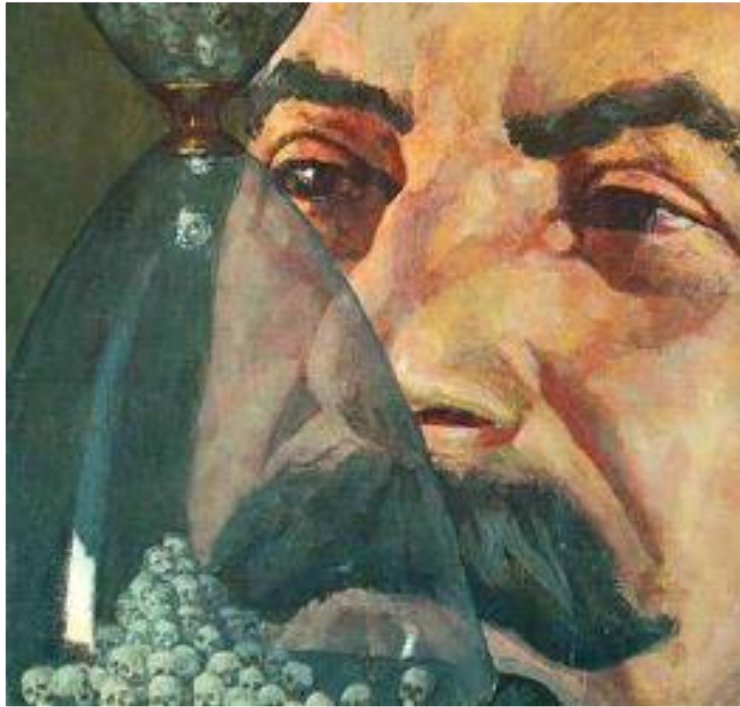
П.Белов. Песочные часы.

В 30-е гг. была завершена ликвидация разномыслия в художественной культуре. Отныне искусство должно следовать одному направлению-социалистическому реализму и показывать жизнь такой, какой она должна быть в представлении партийных вождей. Искусство стало насаждать мифы и создавать иллюзию, что счастливое время уже наступило. Используя его власти умело манипулировали общественным мнением и направляли его в нужное русло.