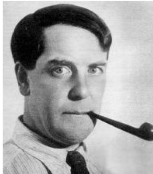
А.Иоффе и П.Капица

Несмотря на идеологическое давление представители естественных наук смогли добиться выдающихся успехов. С.Вавилов(оптика), А.Иоффе(физика кристаллов),П.Капица(микрофизика),И.Курчатов(ядерная физика) и др. обогатили мировую науку. Химики Н.Зелинский, А.Бах,С.Лебедев сделали фунда-ментальные открытия в области получения искусственных веществ и органических пищевых про-