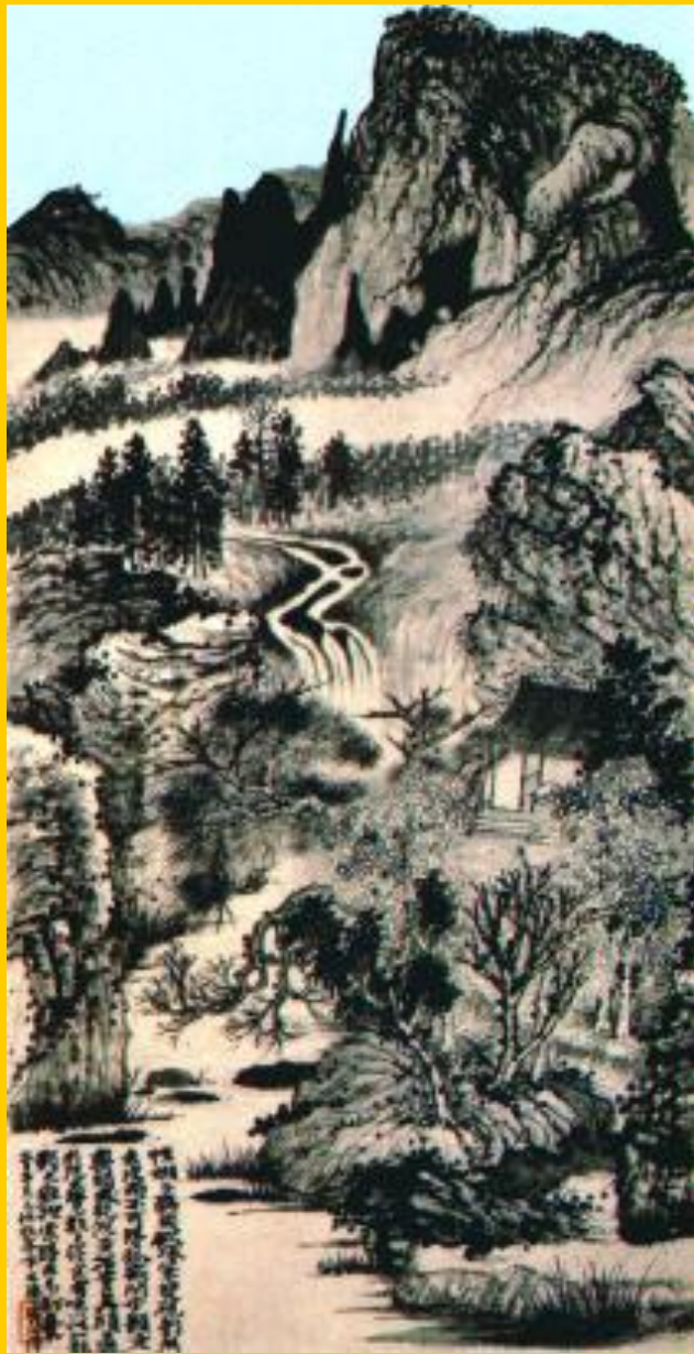
Горная река. Китай. 16 в.

Идеал Востока-гармония с природой, приспособление к ней и созерцание ее. Человек Востока чувствует себя частичкой природы.