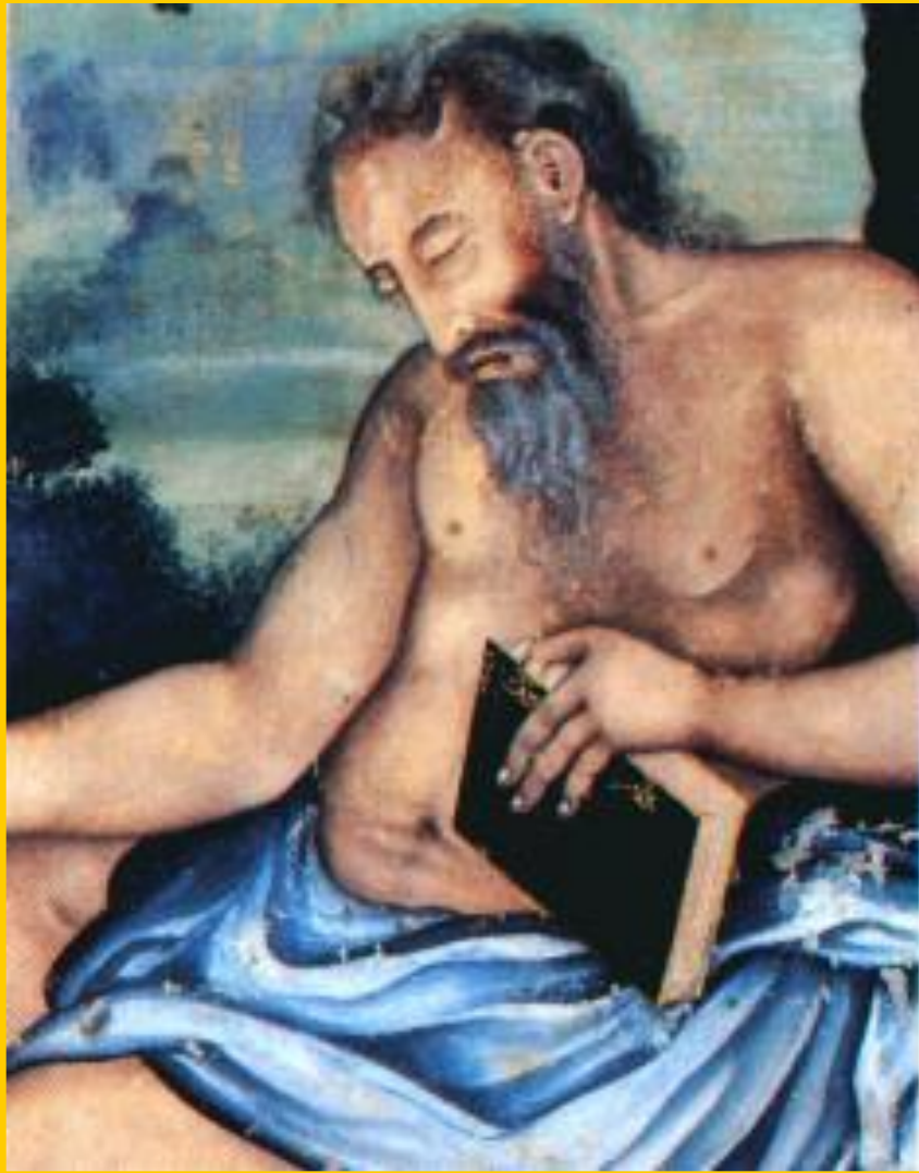
Мудрец. Индия. 16 в.

Люди Востока резко отличаются друг от друга, но при встрече с европейцами они ведут себя одинаково: на Западе свобода-естественное состояние, на Востоке-все общество строится на праве государства распоряжаться жизнью его членов.