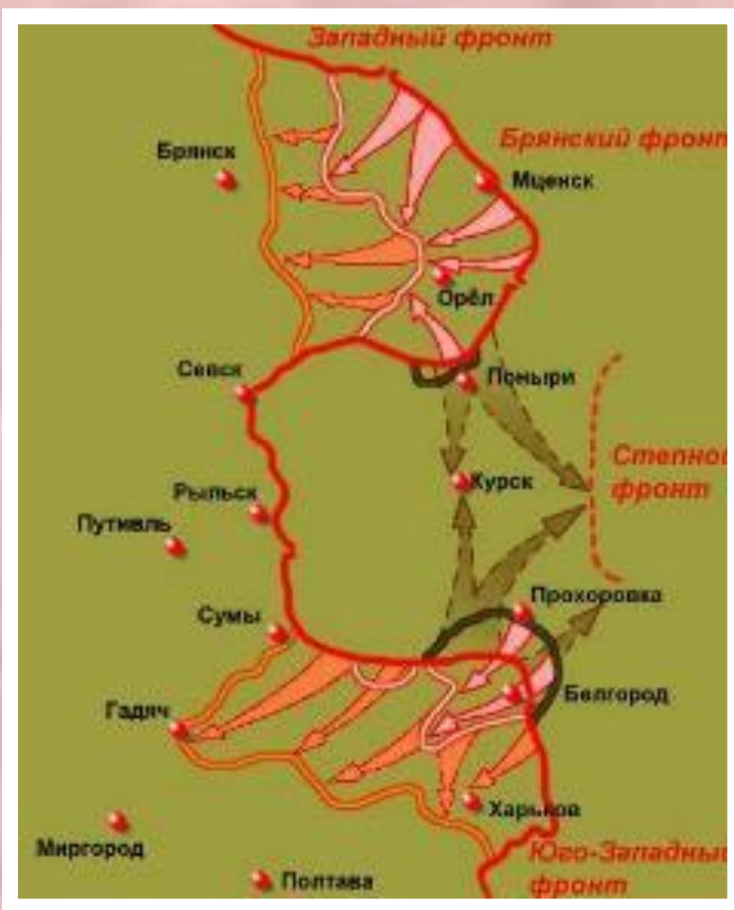
Битва на Курской Дуге.

Эти поражения обескровили немецкую армию, но Гитлер жаждал реванша. Он провел мобилизацию и направил на фронт 2 млн солдат. На вооружение немцев были поставлены танки «Тигр» и «Пантера», штурмовые орудия «Фердинанд». Немецкое руководство намеревалось «срезать» Курскую дугу и взять реванш за Сталинград. По предложению Жукова Красная Армия перешла к преднамеренной обороне. К этому времени она получила новые танки Т-34.