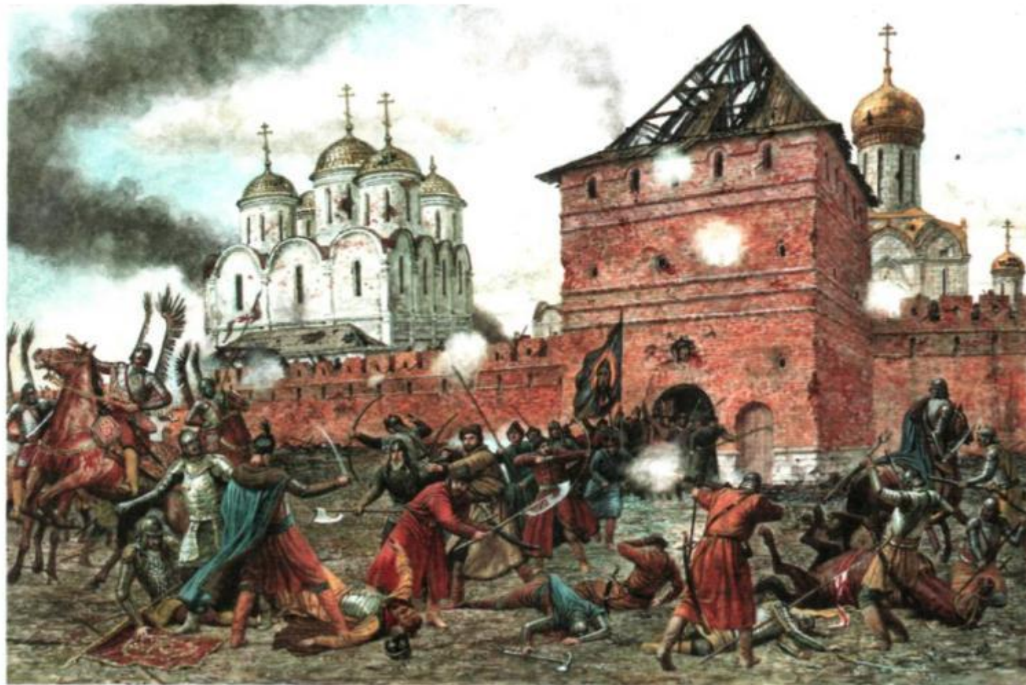
Оборона Троице-Сергиевой Лавры от польских интервентов