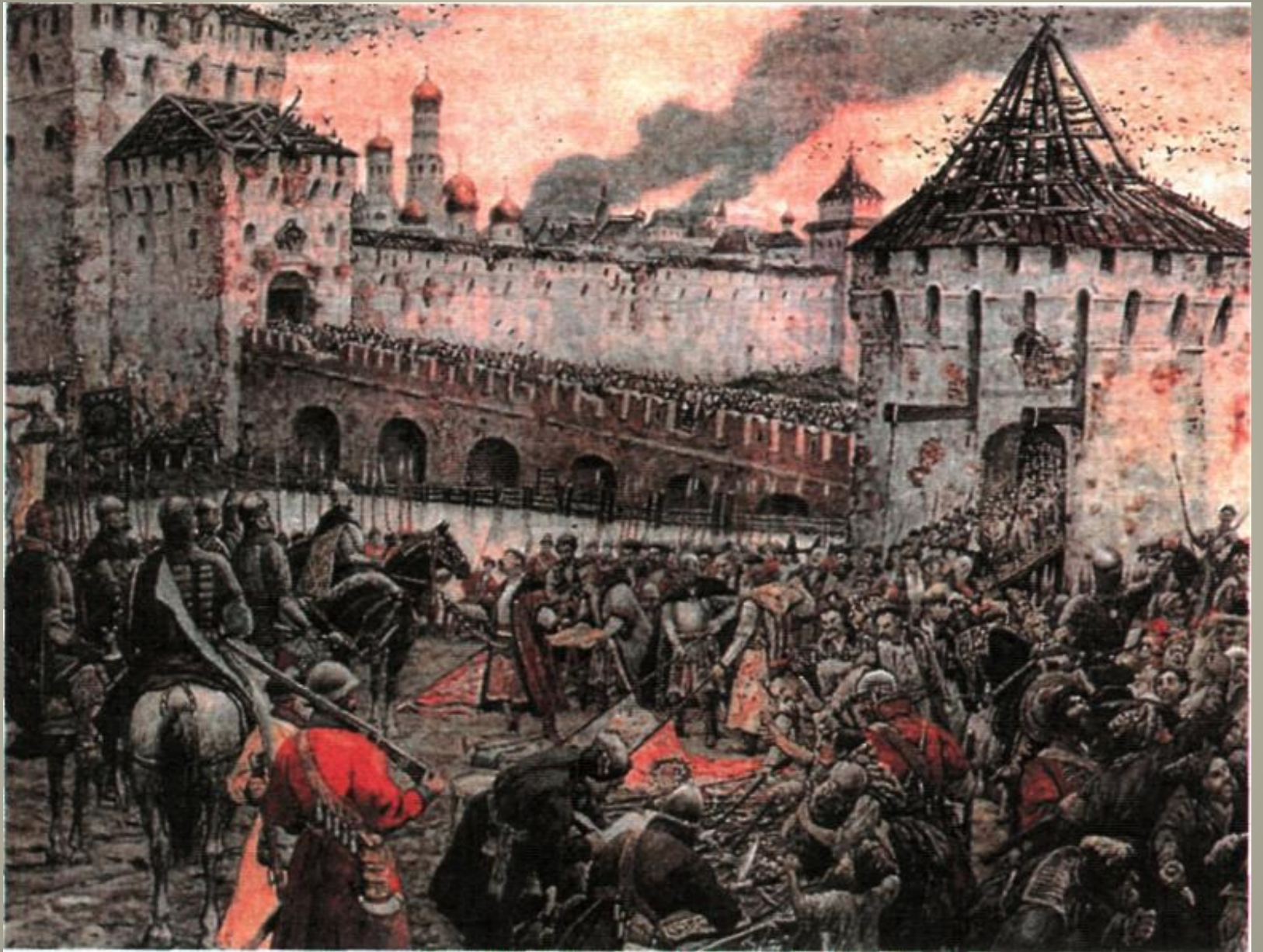
Изгнание польских интервентов из Московского Кремля