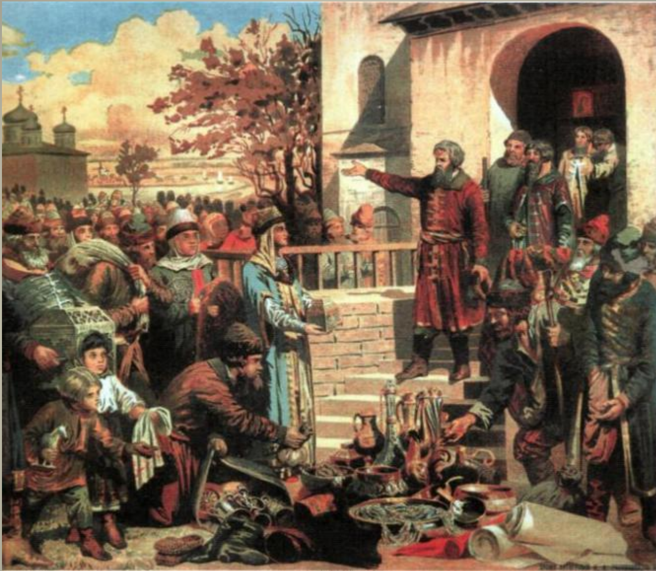
Воззвание Минина к нижегородцам