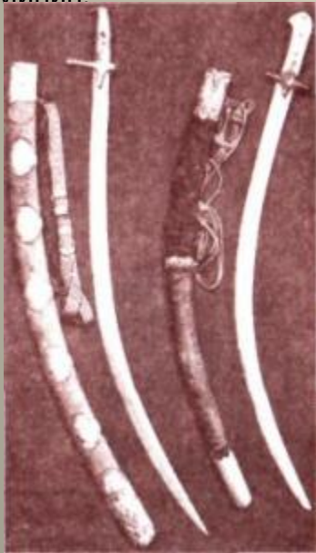
Сабли К.Минина и Д. Пожарского