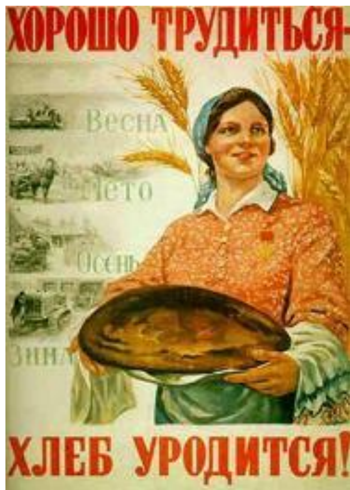
М.Соловьев. Плакат 1947 г.

Несмотря на эти трудности поставка зерна за границу продолжилась. Ежегодно увеличивались денежные и натуральные налоги. У колхозников отобрали приусадебные участки и отдали их колхозам. В 1948 г. Крестьянам рекомендовали продать государству мелкий скот и в ответ было зарезано 2 млн голов скота. Крестьяне не имели паспортов и не могли выехать в город. В результате снижения производства хлеба в н.50-х г. СССР начал закупать его за границей.