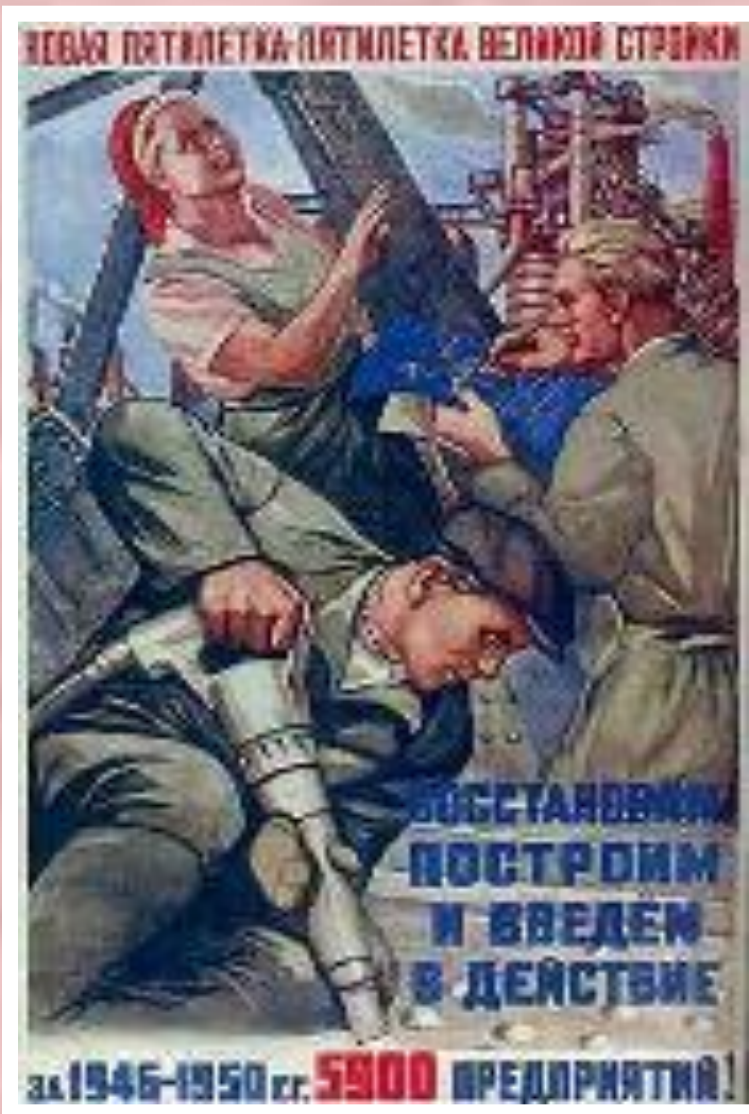
Плакат 1946 г.

Тем не менее главным источником восстановления оставалось село-закупочные цены в 10-12 раз были ниже розничных. На восстановлении работали пленные и узники ГУЛАГа. Огромную роль продолжало играть соцсоревнование. Токарь Г.Борткевич в 1948 г. выполнил 13 сменных норм за день. К 1949 г. экономика была восстановлена плановое задание было перевыполнено в промышленности на 70% в сельском хозяйстве - на 48%.