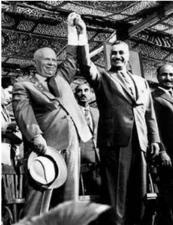
Н.С.Хрущев и Г.А.Насер.

Укреплялись отношения со странами-лидерами Движения-Индией, Индонезией, Египтом. Их руководители нанесли визиты в СССР, им оказывалась военная и экономическая помощь. СССР поставлял оружие в страны Азии, Африки, Латинской Америки. При его поддержке Египет национализировал Суэцкий канал, Индонезия освободила о. Тимор. В ответ США начали поддержку Израиля и Пакистана. Это привело к новым конфликтам.