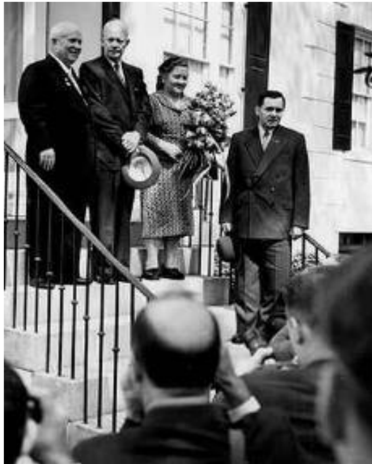
Визит Н.С.Хрущева в США. 1959 г.

Смерть Сталина совпала по времени с приходом к власти в США Д.Эйзенхауэра. 16.10.1953 г. он обратился к СССР с призывом изменить атмосферу международных отношений, установить мир в Корее, Индокитае, ограничить производство ядерного оружия. В 53-54 гг. были подписаны мирные соглашения по Корее и Индокитаю. Польша, ЧССР и СССР предложили созвать общеевропейское совещание по безопасности и сотрудничеству. В 1955 г. был подписан мирный договор с Австрией.