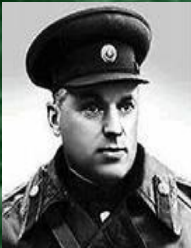
Рокоссовский Константин Константинович