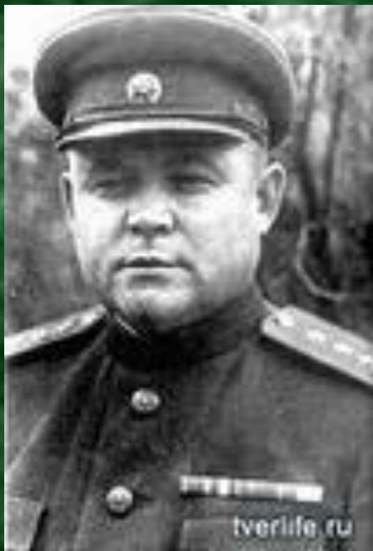
Ватутин Николай Фёдорович