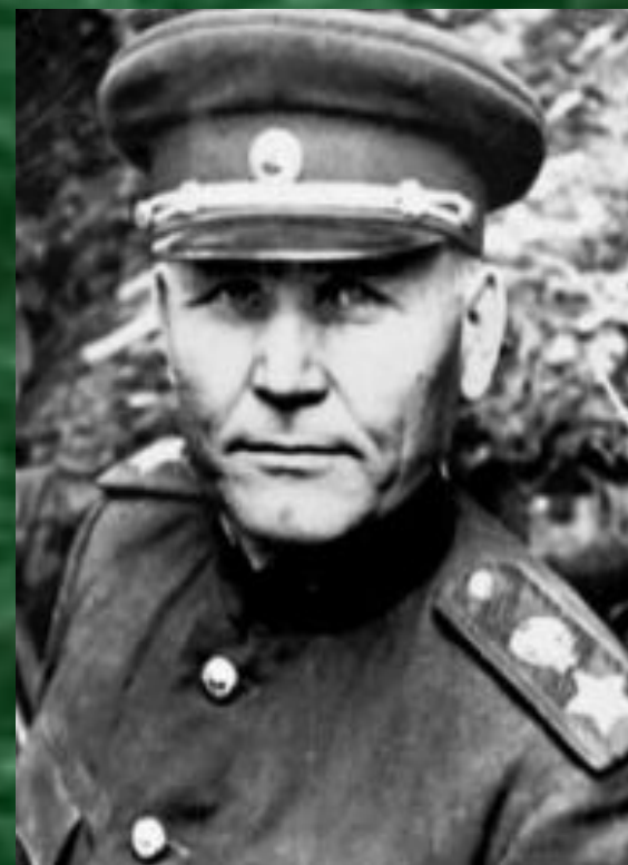
Коне́в Ива́н Степа́нович