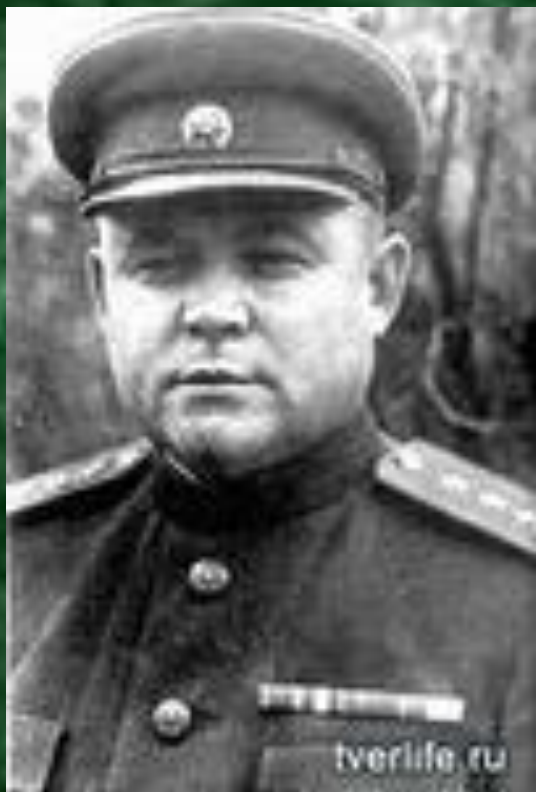
Вату́тин Никола́й Фёдорович