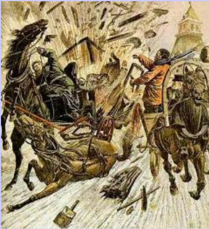
Убийство Великого князя Сергея Александровича

Главное место в программе занимал аграрный вопрос. Частная собственность на землю ликвидировалась. Земля передается в собственность общин Эсеры в качестве метода борьбы избрали террор. В 1901г. создается Боевая организация. Вскоре ее возглавил Е.Азеф-агент полиции. Уже в начале века эсеры совершили убийства В.Плеве и Великого князя Сергея Александровича, а также ряд др. террористических актов.