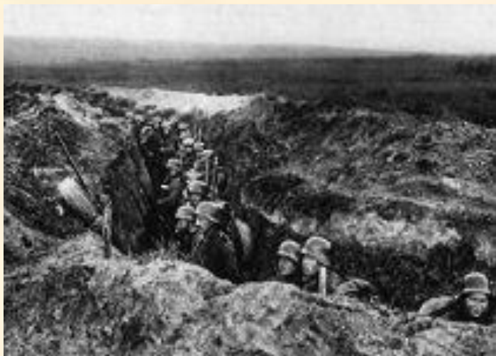
Германские окопы, июль 1918 г.