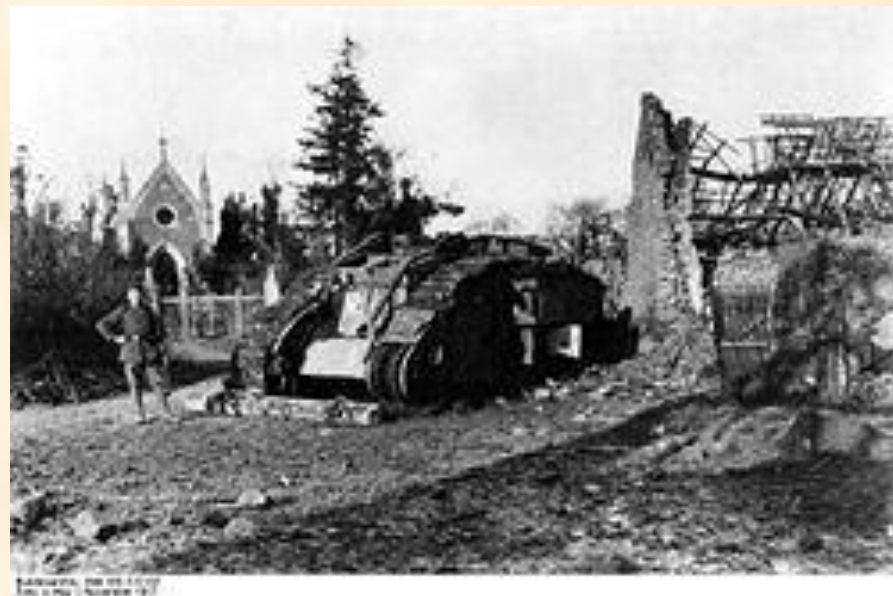
Подбитый английский танк