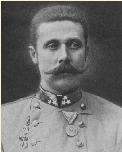
Эрцгерцог Франц Фердинанд

Общепринято, что непосредственно поводом к началу военных действий явилось Сараевское убийство 28 июня 1914 г. эрцгерцога Франца Фердинанда сербским националистом Гаврило Принципом.