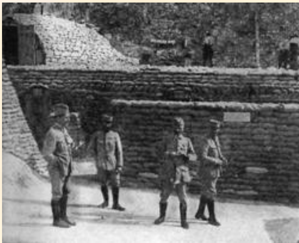
Французские оборонные сооружения, Сомма, 1916 г.