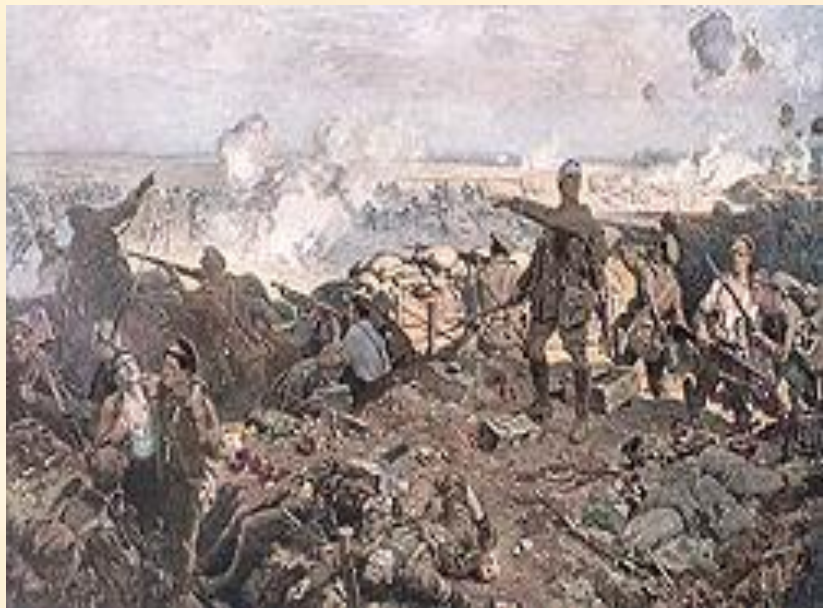
Вторая битва при Ипре