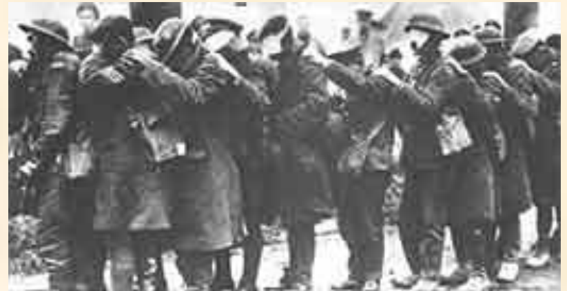
Пострадавшие от газовой атаки английские солдаты