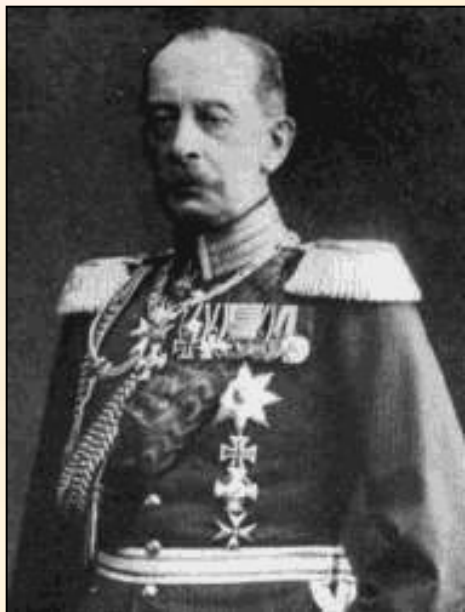
Альберт фон Шлиффен

стратегический план командования Германской империи, который был разработан в начале XX века, чтобы одержать быструю победу в Первой мировой войне на Западном фронте в войне с Францией, и в войне с Россией на Восточном. В последующей, измененной вариации, план был предназначен для победы в течение первого месяца Первой мировой войны; но неудачные изменения первоначального плана, некоторые тактические просчёты, а также на удивление быстрое наступление русской армии завершило немецкое наступление, и вылилось в годы позиционной войны.