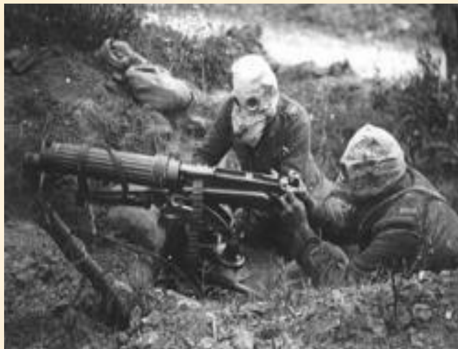
Британские солдаты отражают контратаку