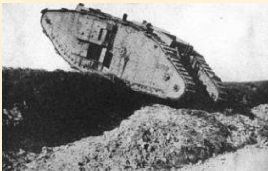
Британский танк пересекает германскую траншею