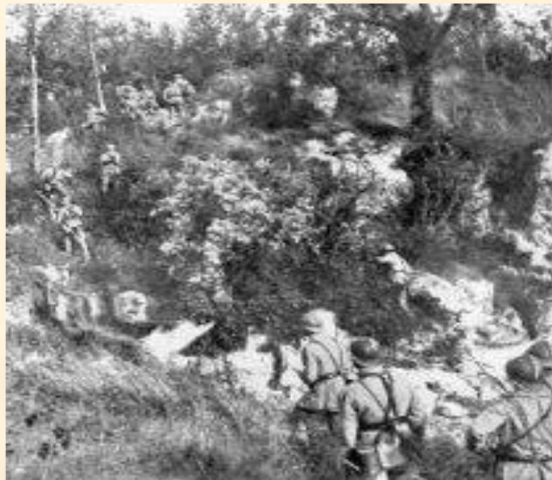
Французский патруль. Марна, 1918 г.