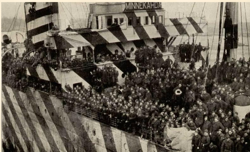
Победоносные американские войска возвращаются домой