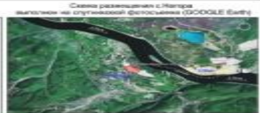
Схема размещения с. Натоя в системе расселения Бокситского района