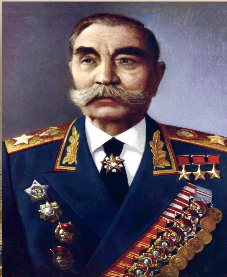
Войсками Северо-Кавказского фронта командовал С.М.Буденный.