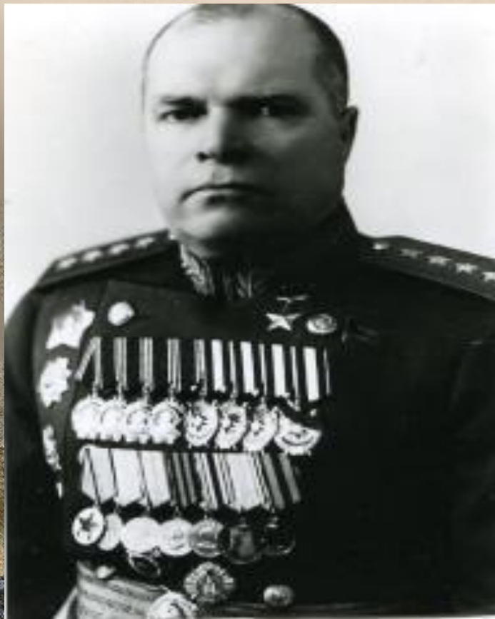
Войсками Северо-Кавказского фронта командовал генерал И. И. Масленников.