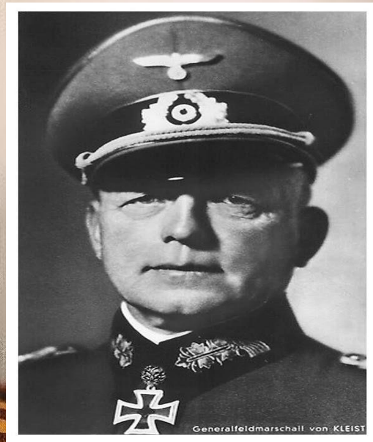
Войсками противника командовал генерал-фельдмаршал Эвальд Клейст.