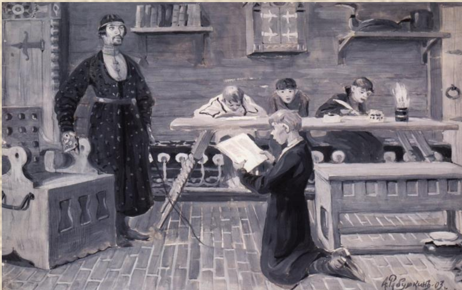
Рябушкин А. «Школа XVII века»

За неаккуратность и за школьные шалости не только секли розгами, но и ставили на несколько часов на колени на горох, оставляя без обеда.