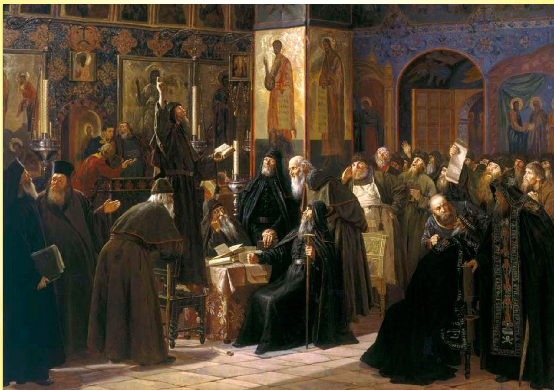
Милорадович С. Чёрный собор. Восстание Соловецкого монастыря против новопечатных книг в 1666 году