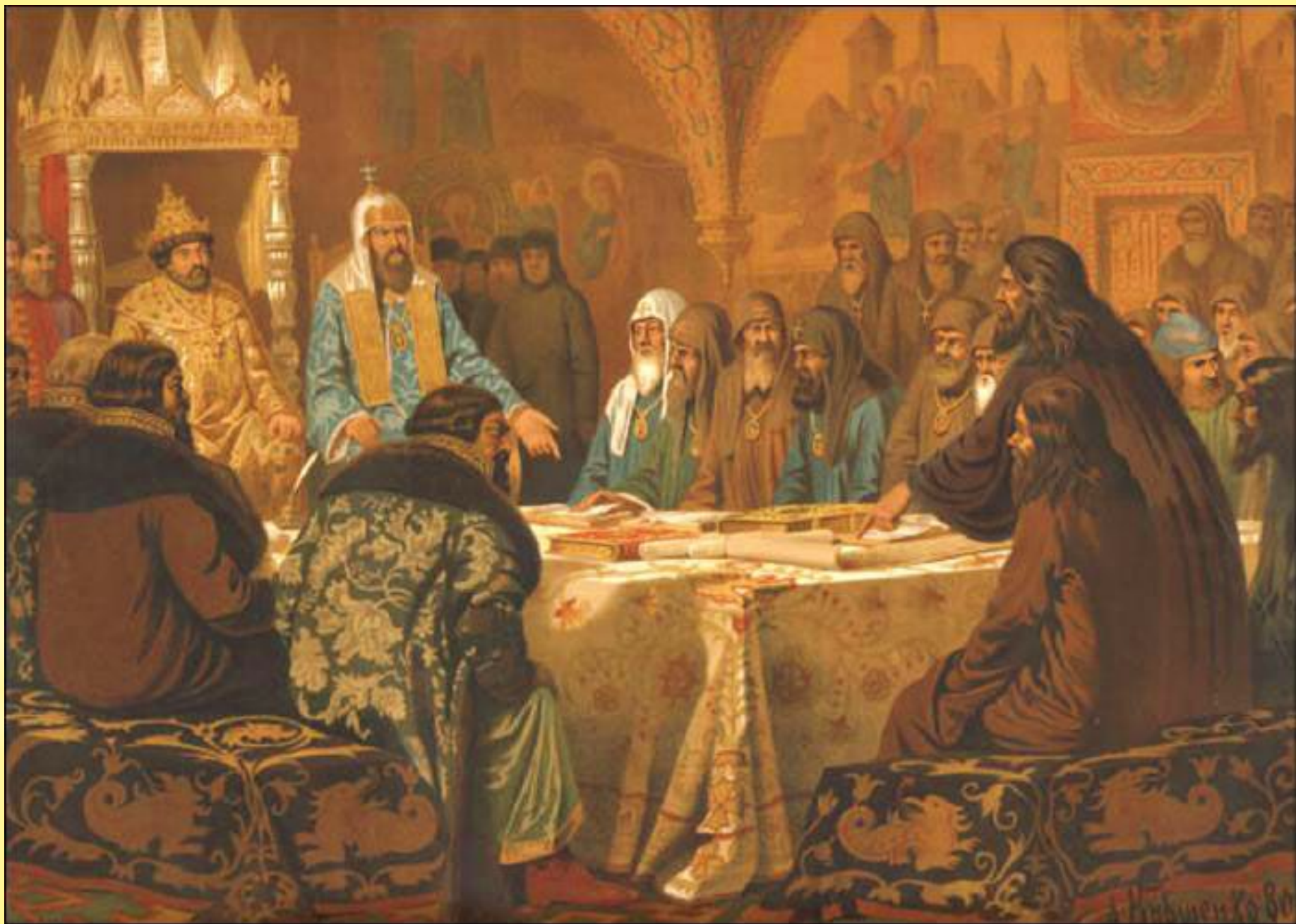
Кившенко А. Патриарх Никон предлагает новые богослужбные книги