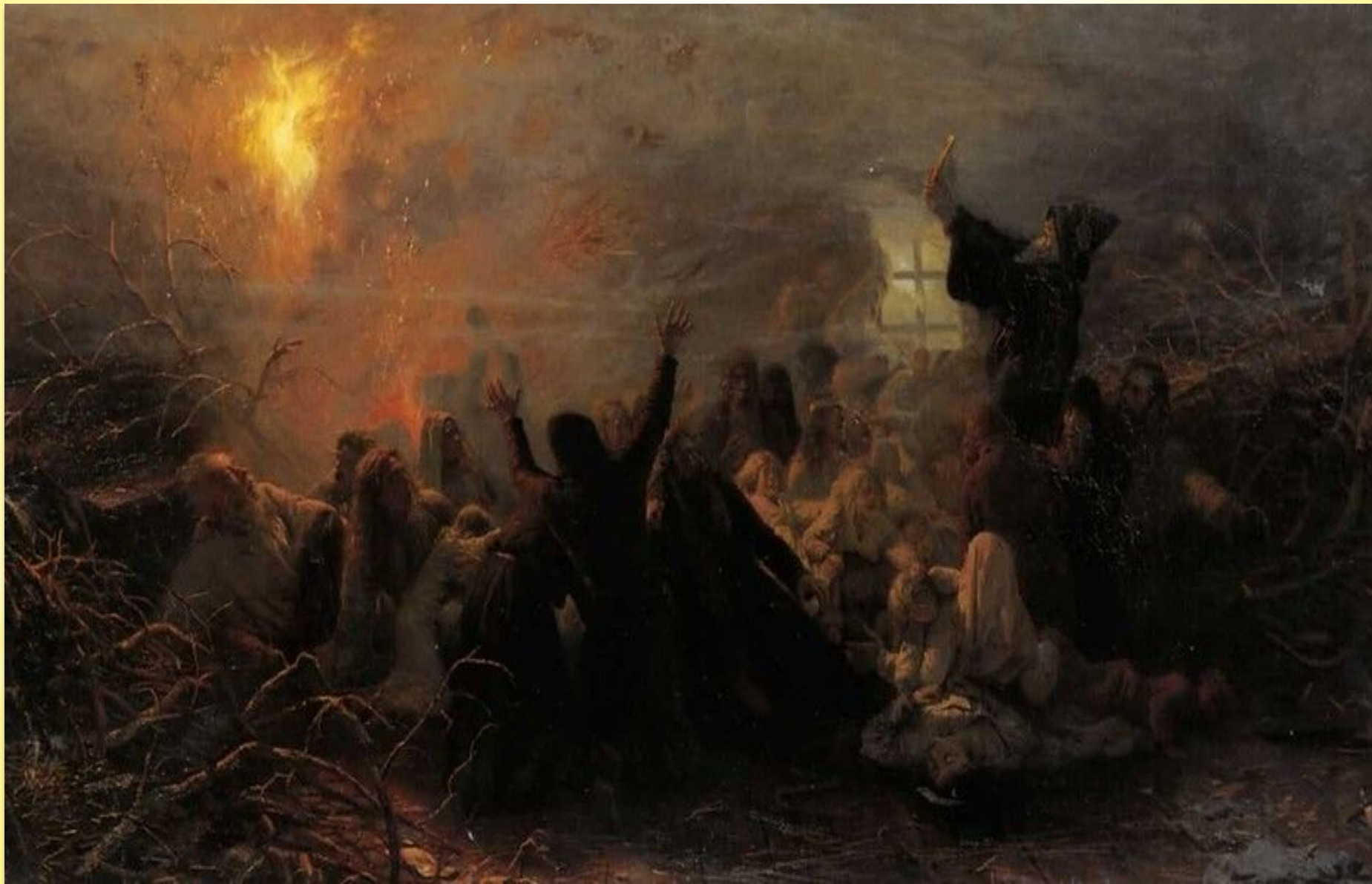
Мясоедов Г. Г. «Самосожигатели»