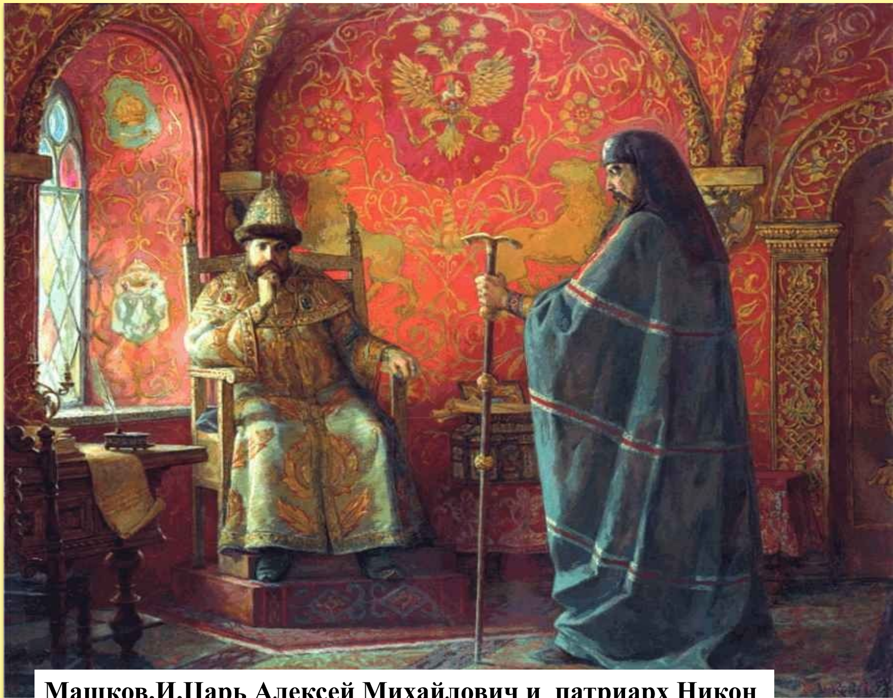
Машков.И.Царь Алексей Михайлович и патриарх Никон