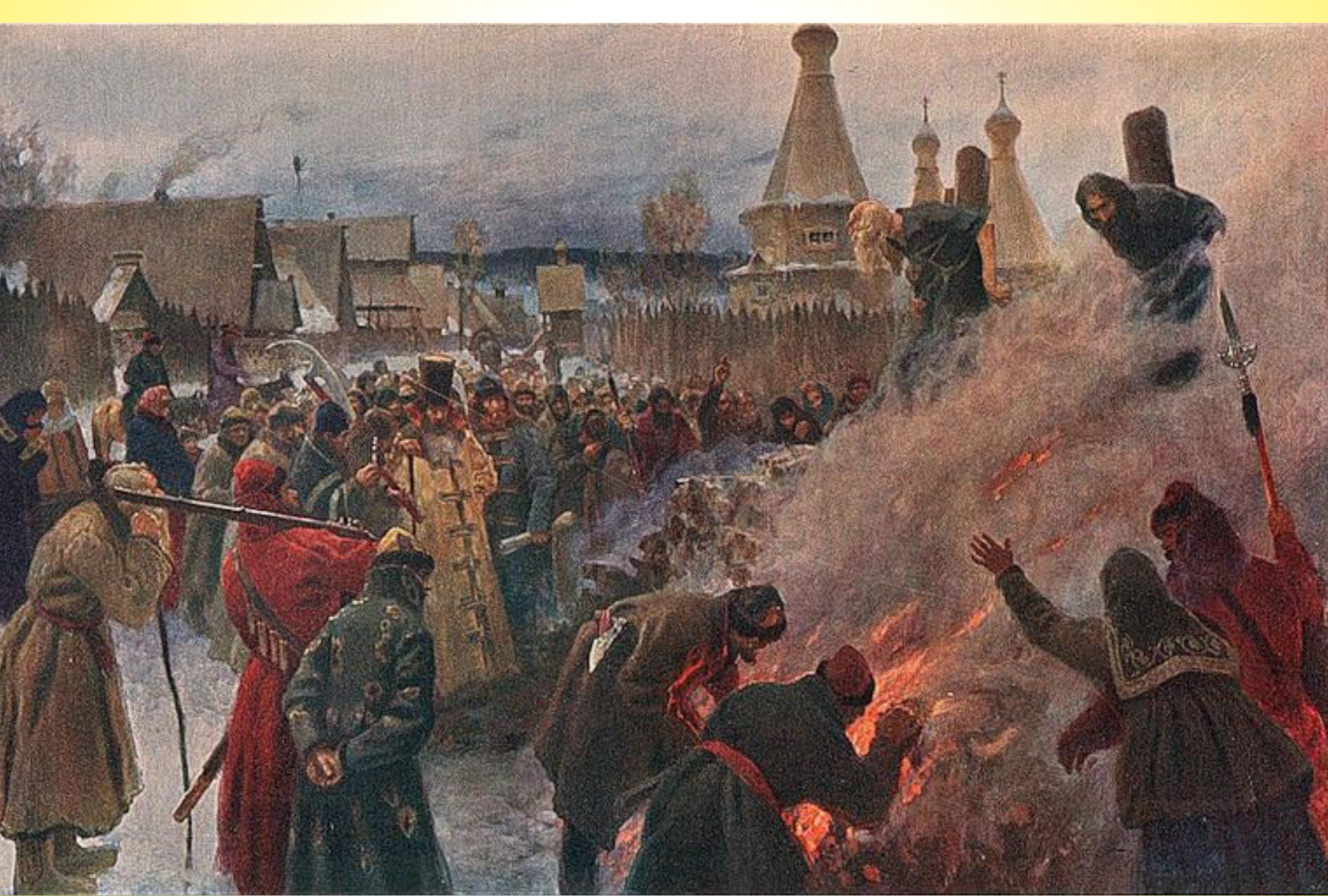
Мясоедов Г. Г. Сожжение протопопа Аввакума.