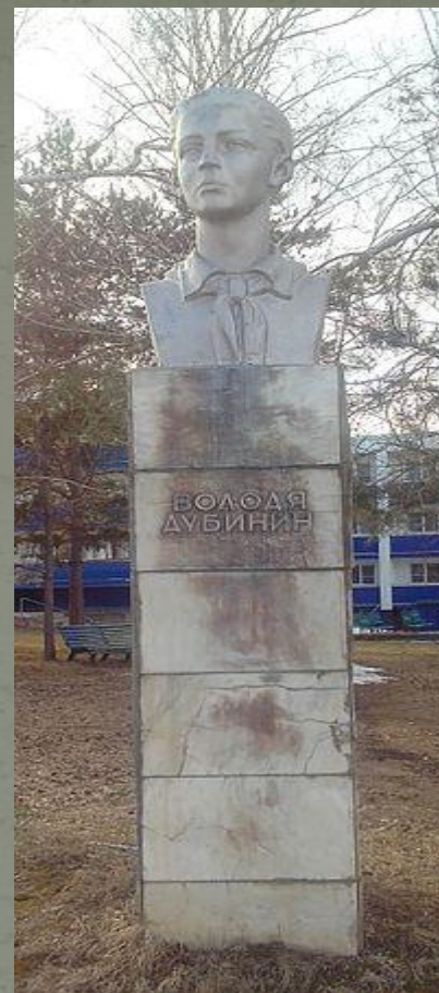
Памятник В. Дубинину на территории быв. пионер. лагеря «Алые паруса» в с. Ягодное близ Тольятти