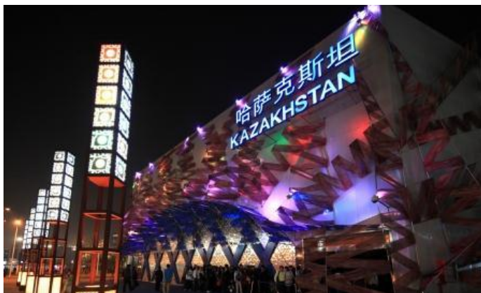
ЭКСПО-2010, ШАНХАЙ, КИТАЙ