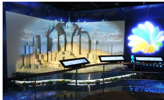
ЭКСПО-2012, ЁСУ, ЮЖНАЯ КОРЕЯ