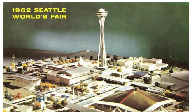
ВСЕМИРНАЯ ВЫСТАВКА 1962 ГОДА, СИЕТТЛ, США