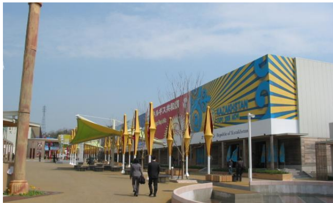
ЭКСПО-2005, АИЧИ, ЯПОНИЯ