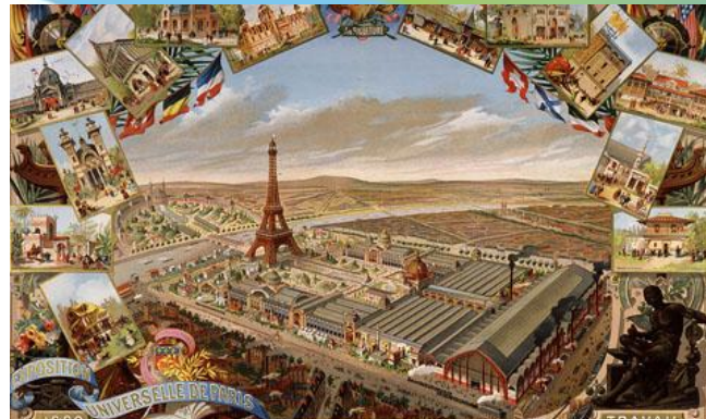
ВСЕМИРНАЯ ВЫСТАВКА 1889 ГОДА, ПАРИЖ, ФРАНЦИЯ