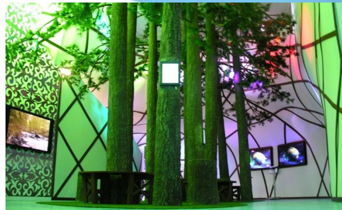
ЭКСПО-2008, САРАГОСА, ИСПАНИЯ