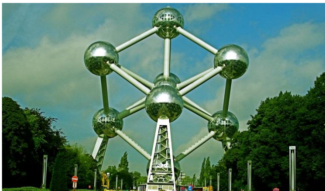
ВСЕМИРНАЯ ВЫСТАВКА 1958 ГОДА, БРЮССЕЛЬ, БЕЛЬГИЯ