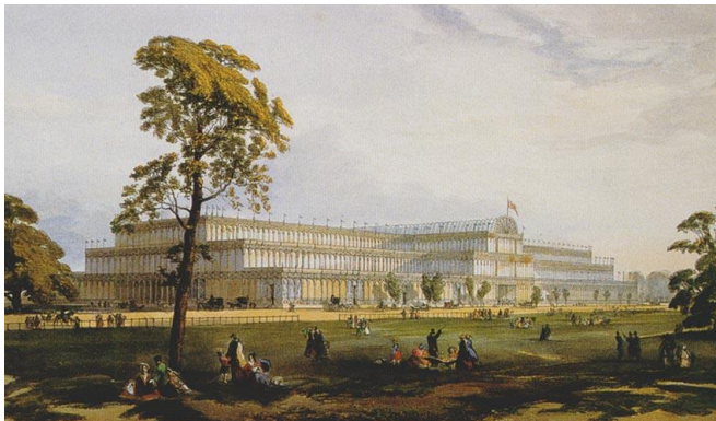
1851 ГОД - ПЕРВАЯ ВСЕМИРНАЯ ВЫСТАВКА В ЛОНДОНЕ, ВЕЛИКОБРИТАНИЯ