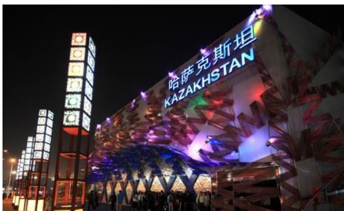
ЭКСПО-2010, ШАНХАЙ, КИТАЙ