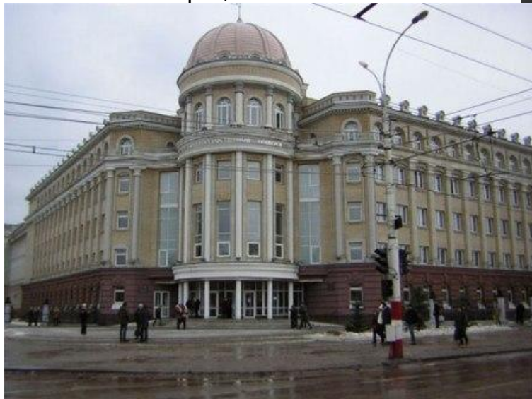
Один из старейших российских университетов — Саратовский государственный — был основан царским указом от 10 июня 1909 года.

Растущая потребность в специалистах способствовала развитию высшего, в особенности технического, образования. В 1912 г. в России было 16 высших технических учебных заведений. К прежнему числу университетов прибавился только один, Саратовский (1909), но количество студентов заметно выросло -- с 14 тысяч в сер. 90-х годов до 35,3 тысяч в 1907 г. Получили распространение частные высшие учебные заведения (Вольная высшая школа П.Ф. Лесгафта,