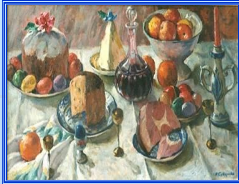
Суворов А.П. «Пасхальный стол»

6 традиционных блюд на пасхальном столе: