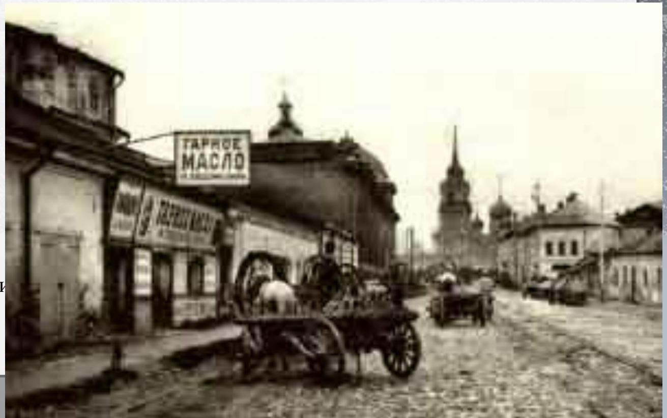
Тула. Воздвиженская улица и Кремль. Фото с открытки начала XX в.