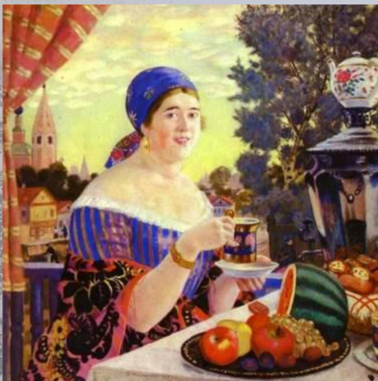
Чаепитие. Б. Кустодиев.