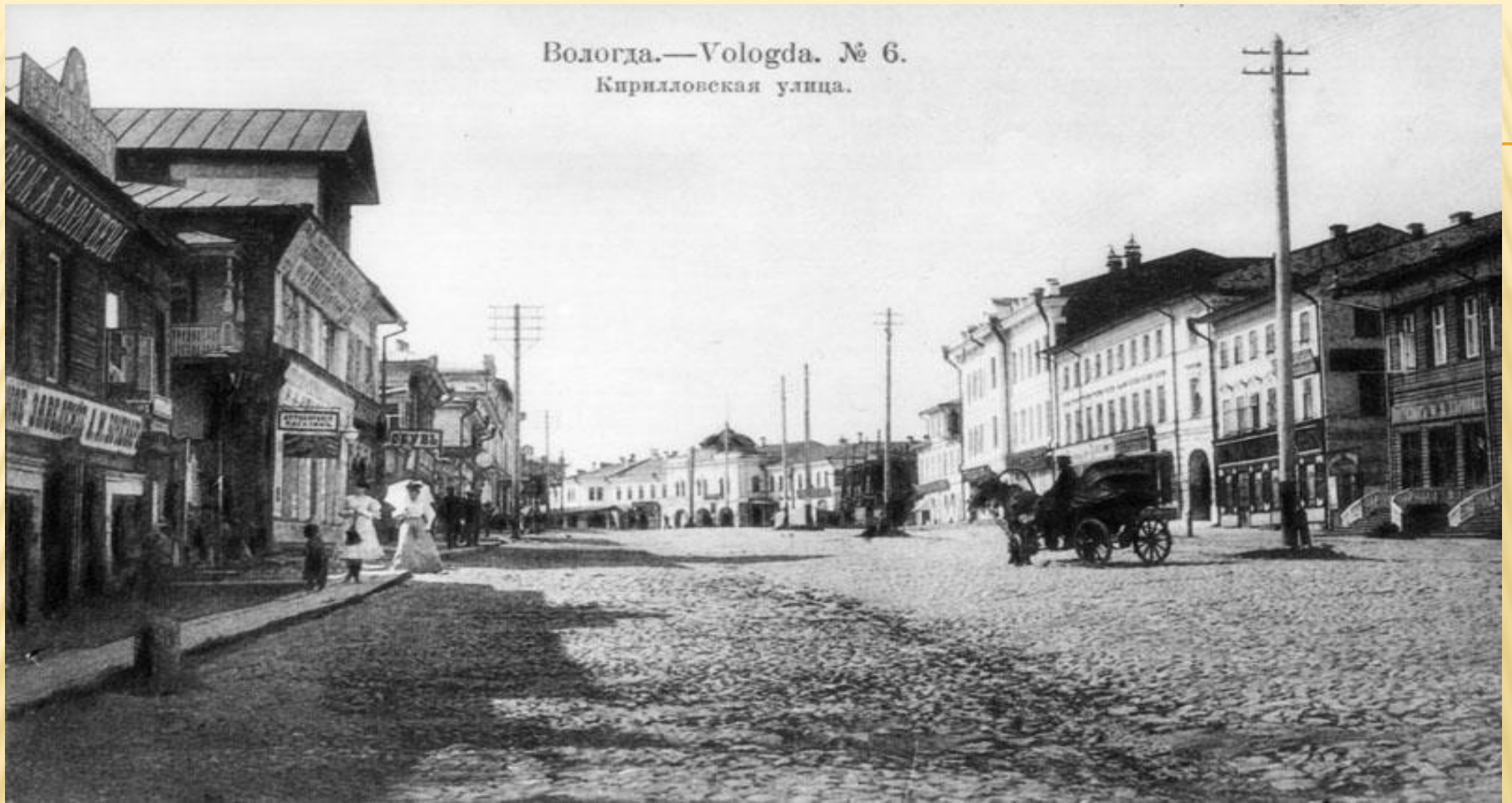
Вологда.—Vologda. № 6. Кирилловская улица.