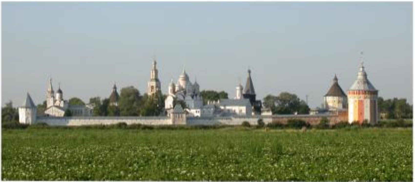
Г. Вологда. Спасо-Прилуцкий монастырь.

Вопрос 6: Во время Отечественной войны 1812 г под Вологдой за крепостными стенами Прилуцкого монастыря хранились ценности, вывезенные из Московского Кремля и Троице-Сергиевой лавры