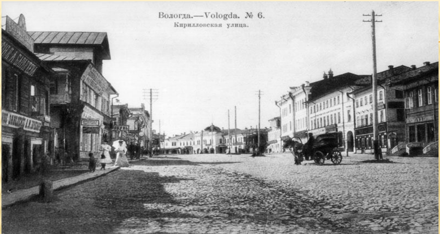
Вологда.—Vologda. № 6. Кирилловская улица.