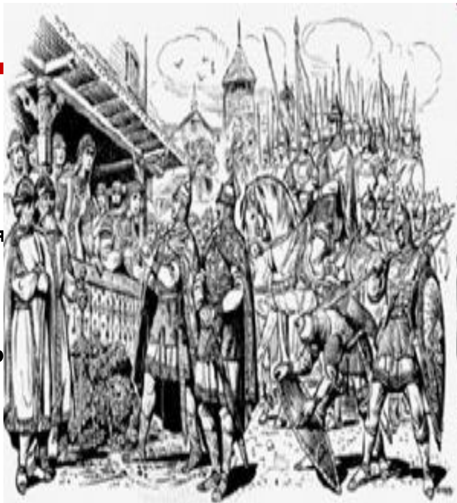
Князя Аскольд и Дир на Киевском берегу.