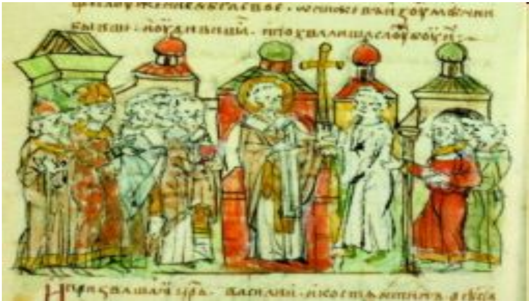
Посланники князя Владимира в Софийском соборе Константинополя. Миниатюра из Радзивилловской летописи.