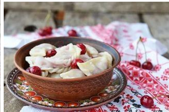
Вареники с вишней