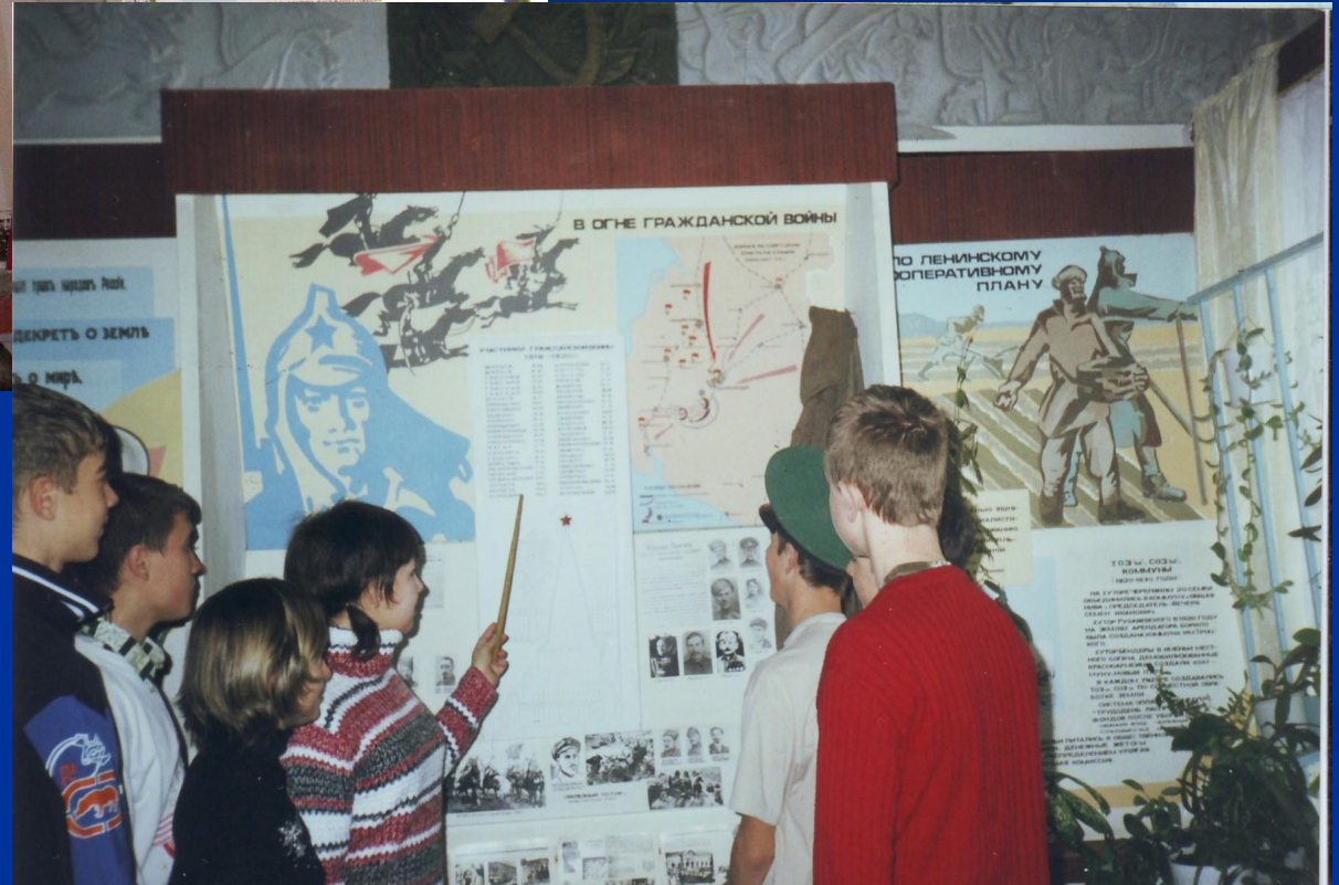
В огне гражданской войны