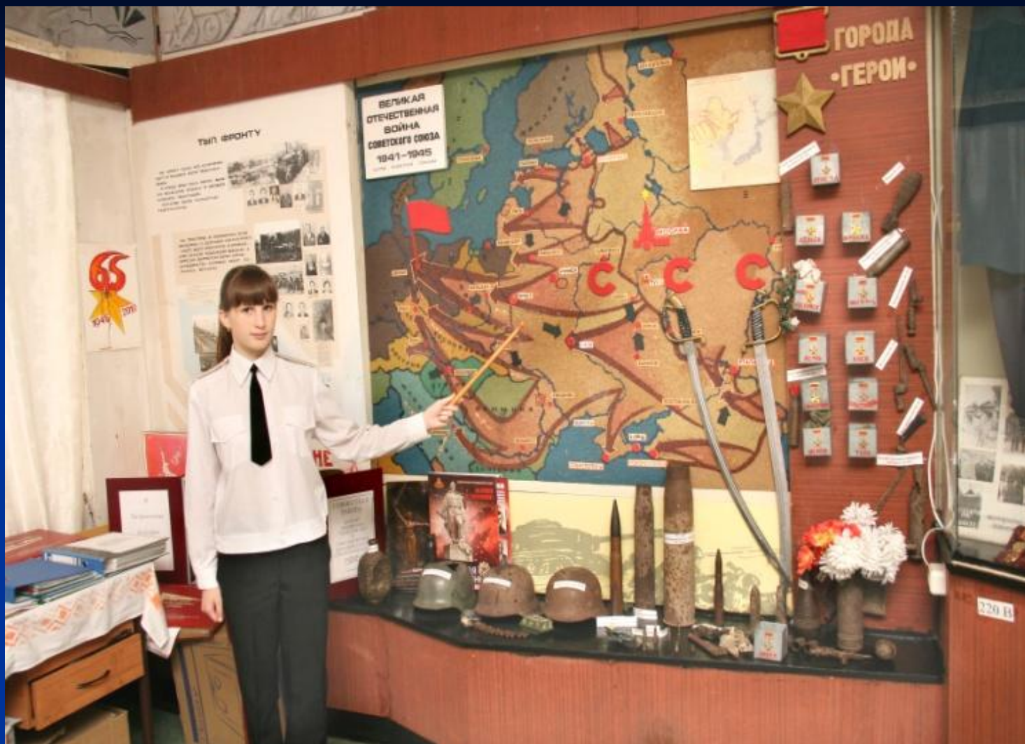
Минувших лет святая память (Великая Отечественная война 1941-1945 гг.)