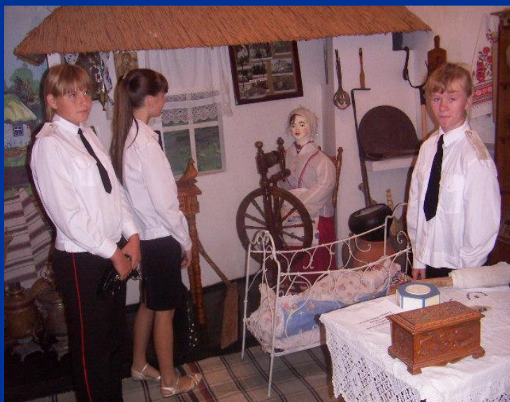
Фрагмент казачьей хаты