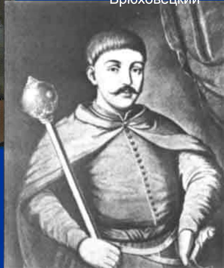
Иван Мартынович Брюховецкий