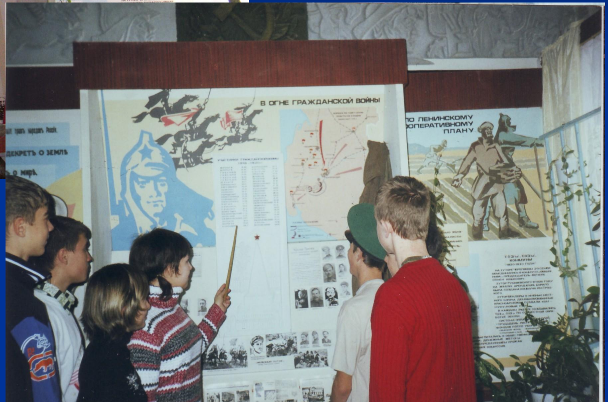
В огне гражданской войны