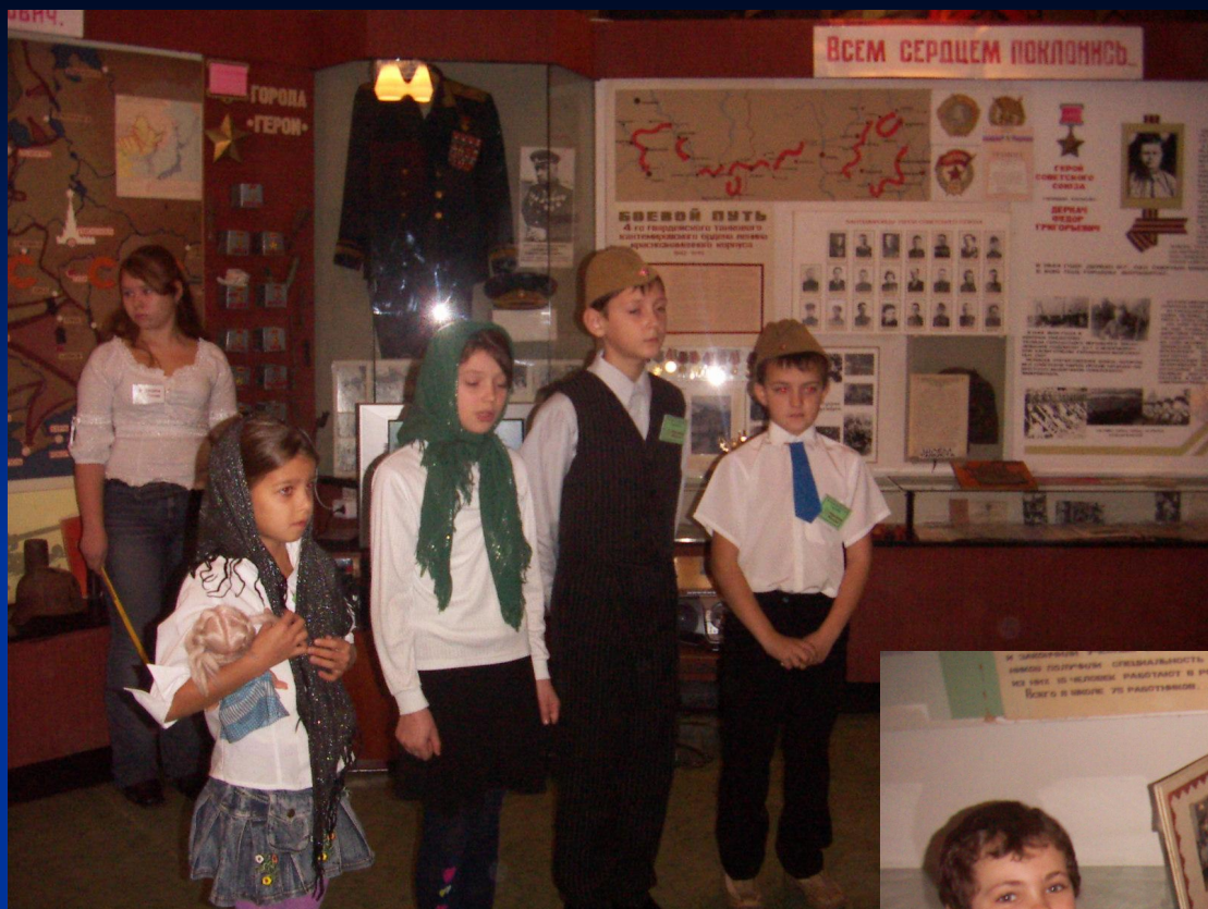
Театрализованное представление «Дети войны»