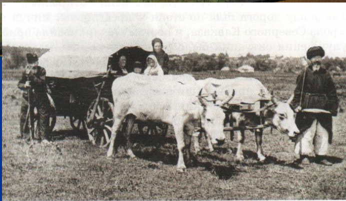
Семья переселенцев. XIX в.