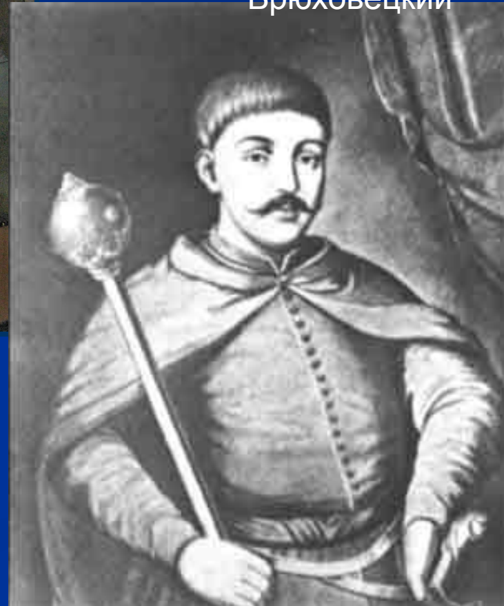
Иван Мартынович Брюховецкий