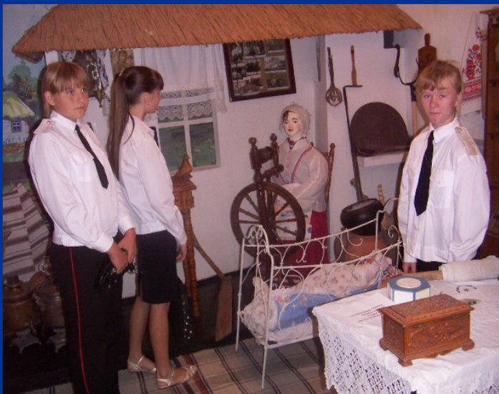
Фрагмент казачьей хаты