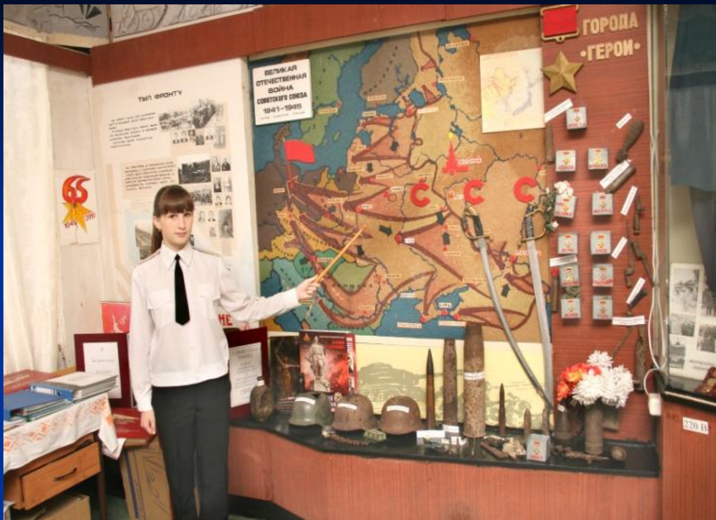
Минувших лет святая память (Великая Отечественная война 1941-1945 гг.)