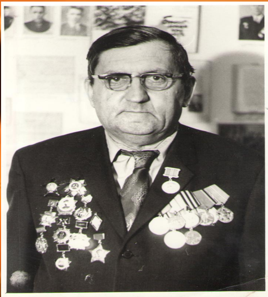
Жданов Анатолий Александрович