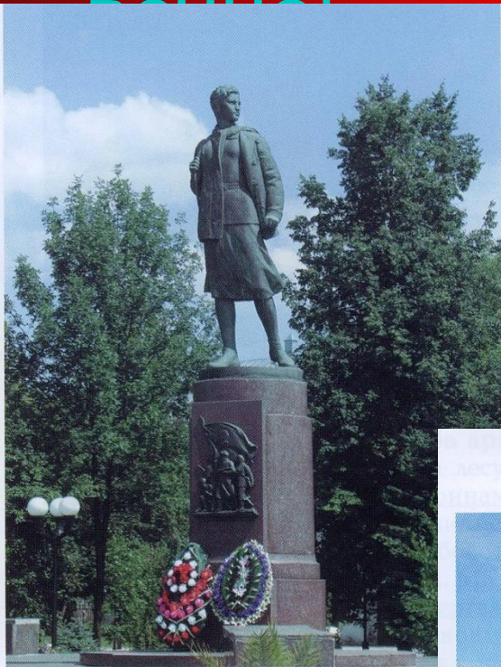
Памятник Герою Советского Союза Зое Космодемьянской.