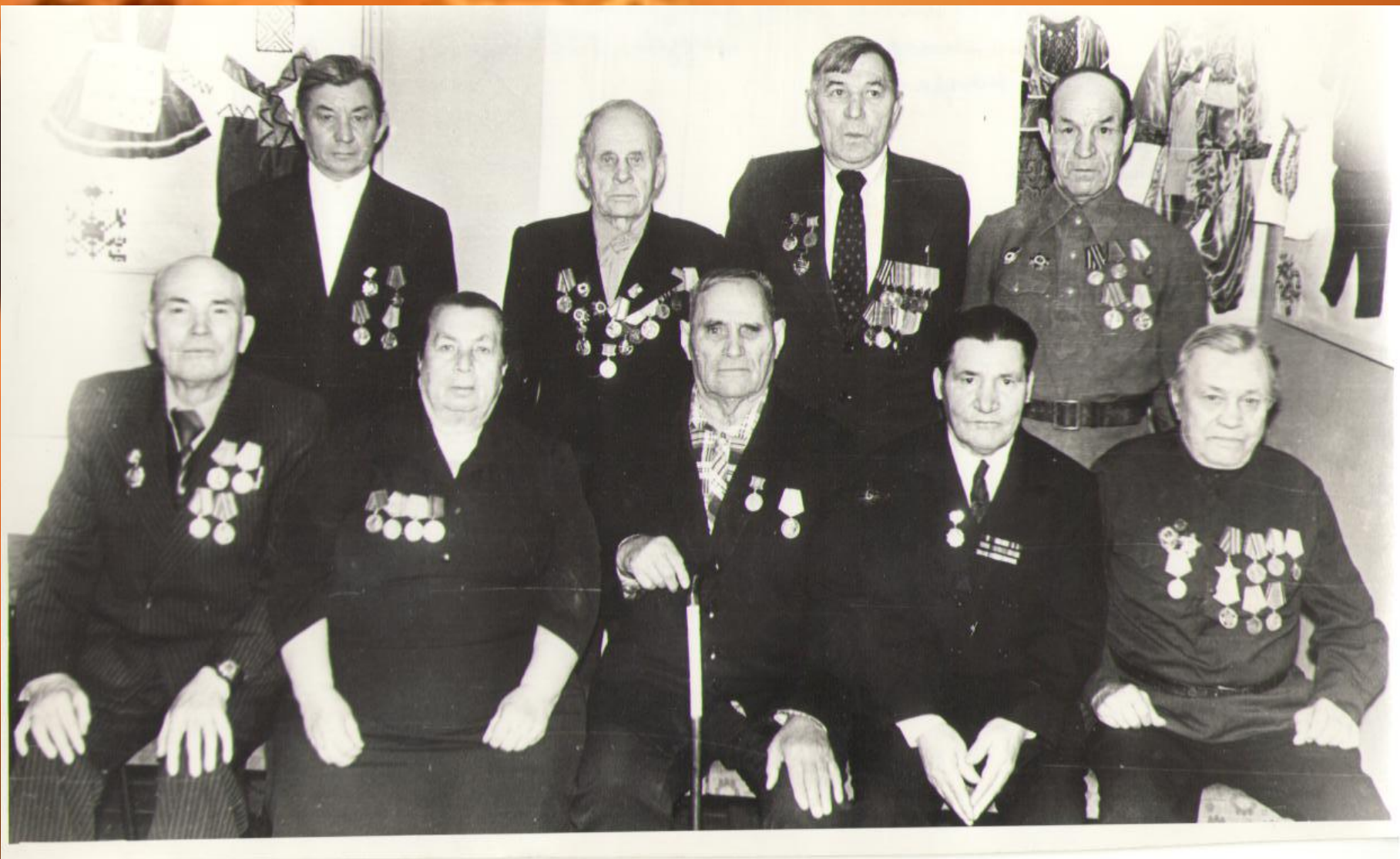
Защитники Сталинграда (1983г)