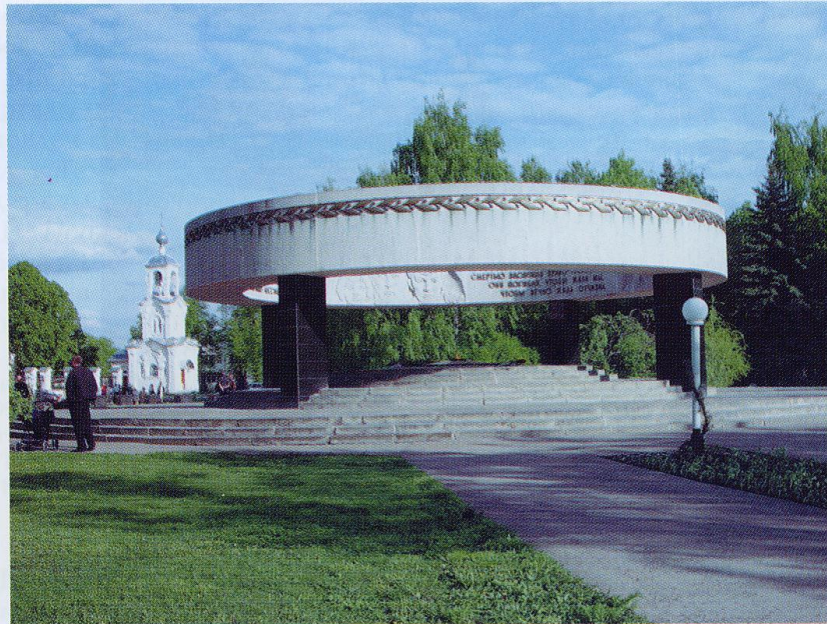
Монумент «Вечная слава».