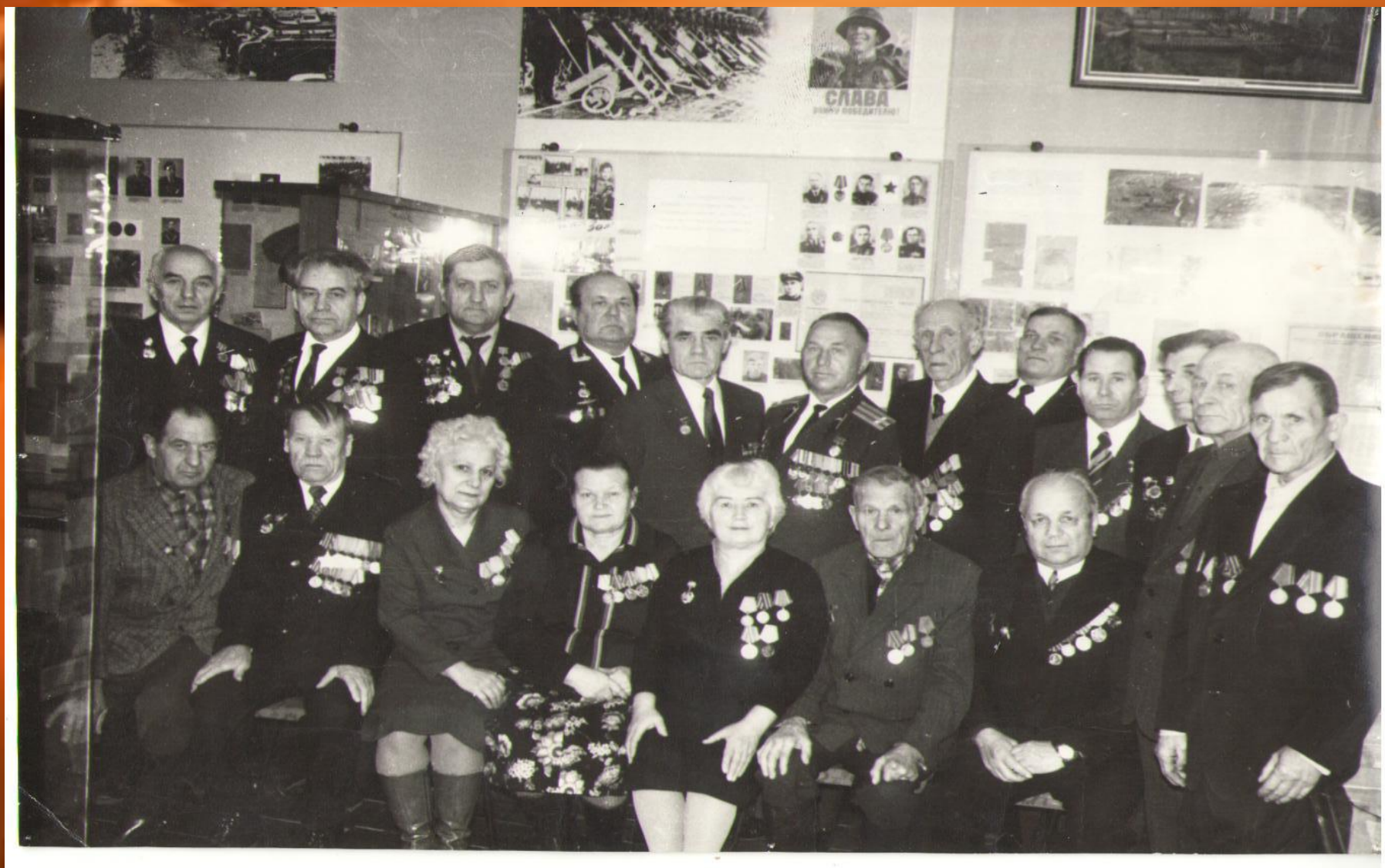
Защитники Сталинграда (1982г)