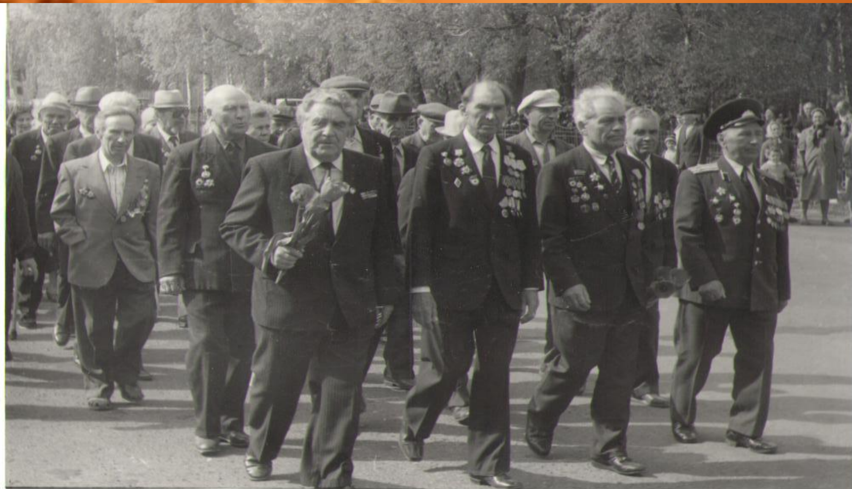
Ветераны на параде Победы (9 мая) г. Кирсанов