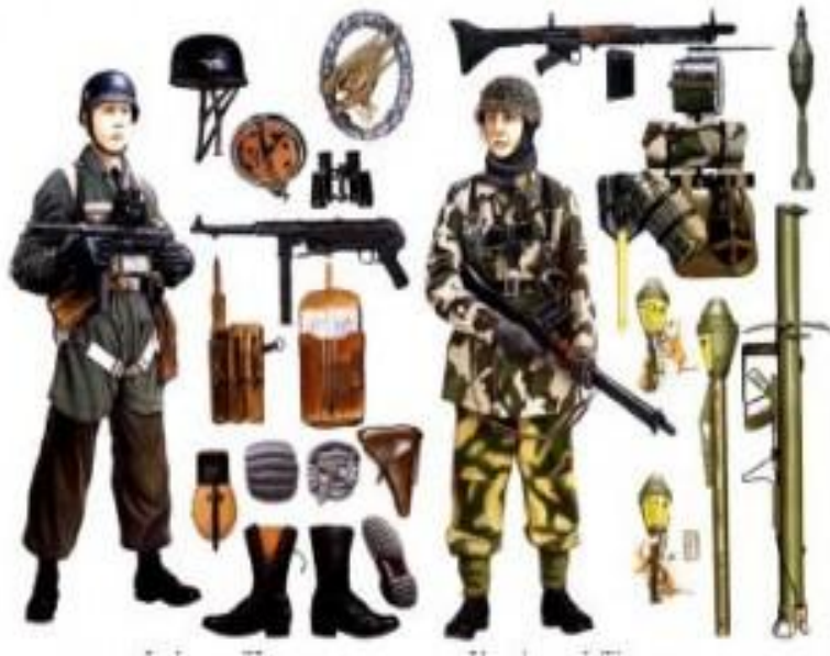
145. Ефрейтор, бригада «Герман Геринг»