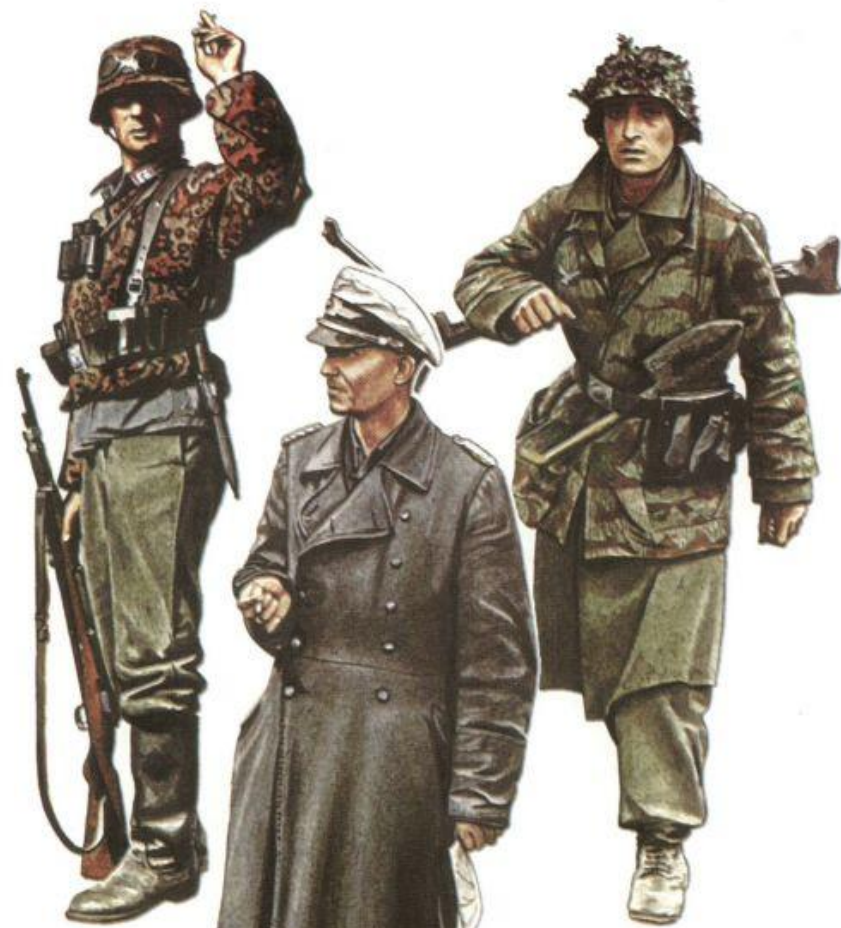
147. Гренадер авиаполевой дивизии