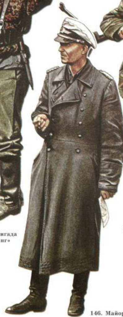
146. Майор парашютно-десантного полка