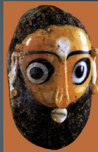
Стеклянная маска из Карфагена 3 в. до н.э.