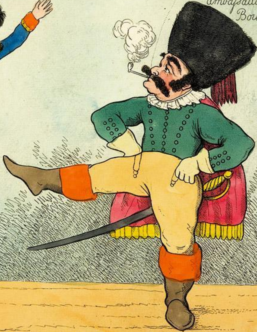
Pub d Jan r 7 th 1807 by Feigy 111 Chiswick London RUSSIAN AMUSEMENT or the CORSICAN footBALL

I'll teach you to insult Ambassadors Master Bouncing B