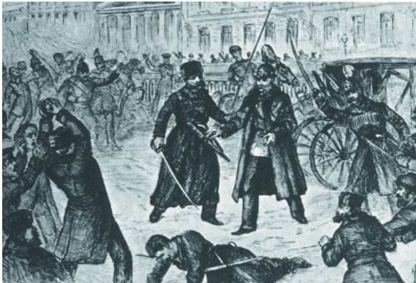
Вторая бомба, брошенная Гриневицким.