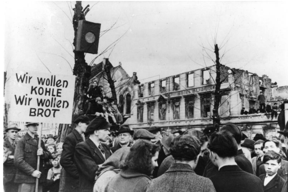
31. März 1947

Итоги второй мировой войны для экономики Западной Германии. Роль "плана Маршалла" и реформ Л.Эрхарда в возрождении германской экономики. Исходное состояние народного хозяйства Западной Германии было плачевным. В поверженной, разрушенной, расколотой стране в руинах летали города, большая часть промышленности была уничтожена бомбардировками или демонтирована победителями. Отдельные сохранившиеся предприятия почти ничего не производили. В 1946 г. промышленное производство составляло около 1/3 от довоенного 1939 г., лет на 30 назад было-отброшено сельское хозяйство.