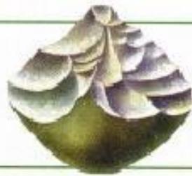
Инструменты из речной гальки