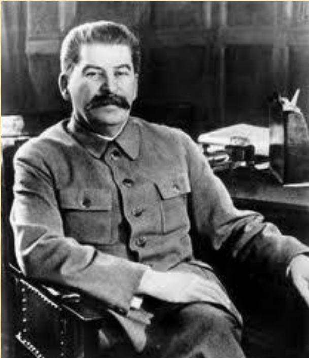
Нарком Обороны И.В. Сталин