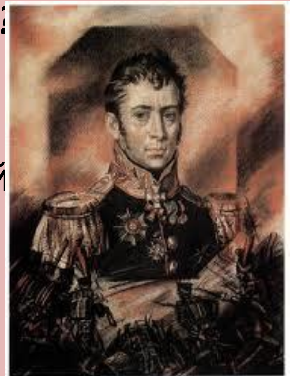
Петр Гаврилович Лихачев 1758—1812