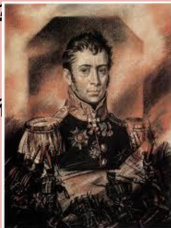
Петр Гаврилович Лихачёв 1758—1812