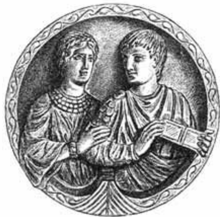
Стилихон и его жена Серена