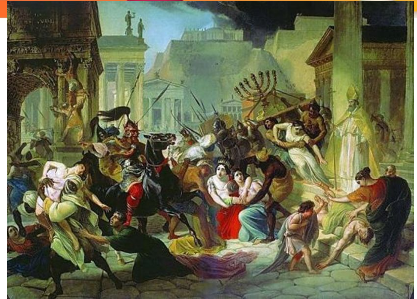
Разорение Рима вандалами в 455 г.