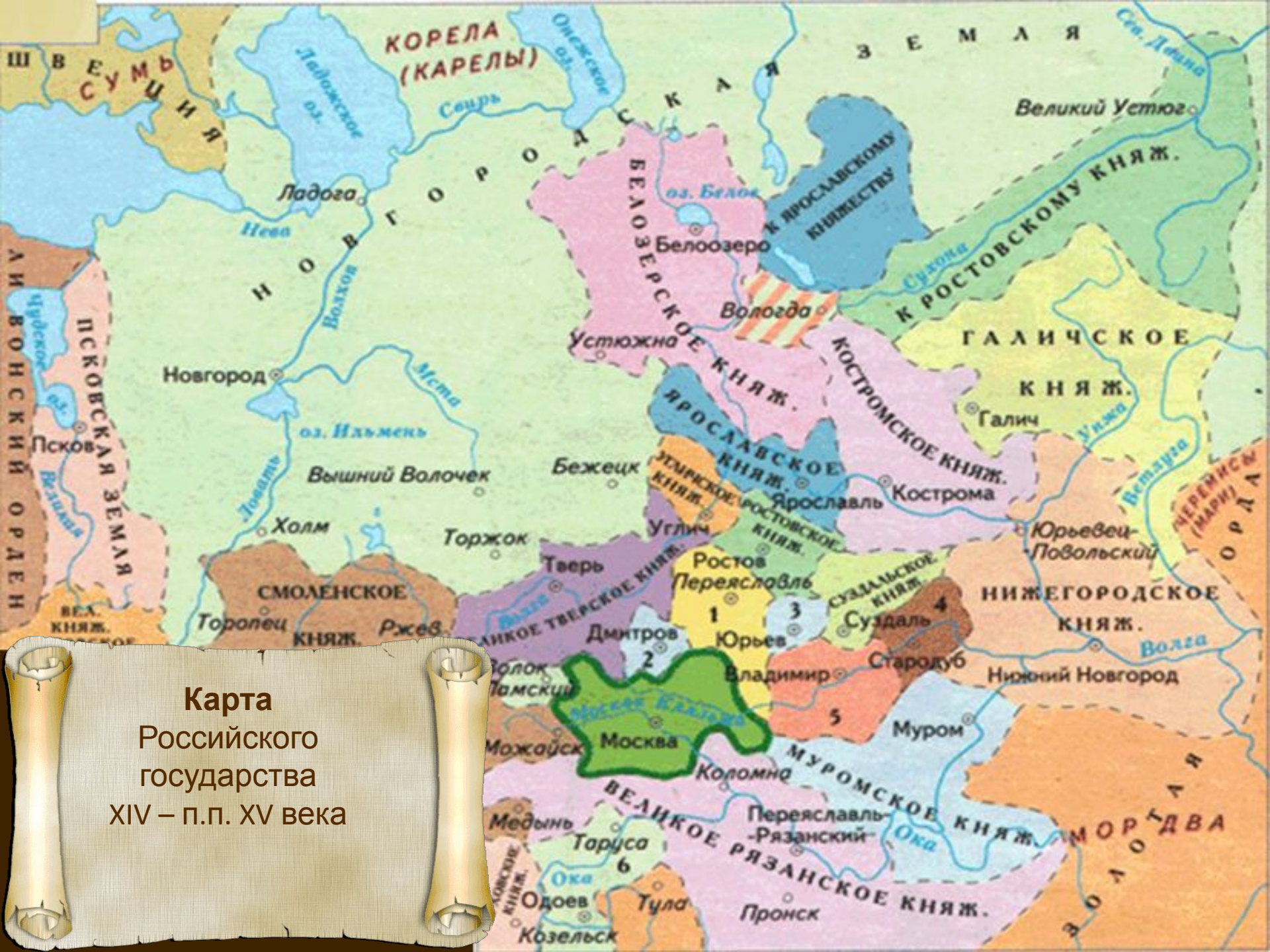
Карта Российского государства XIV – п.п. XV века