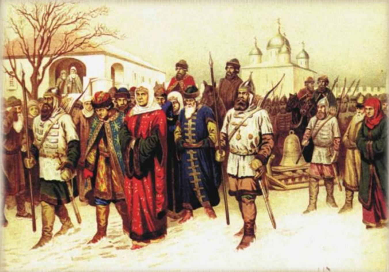
Отправка Марфы Борецкой и Новгородского вечевого колокола в Москву в 1478 году. Художник А. Кившенко