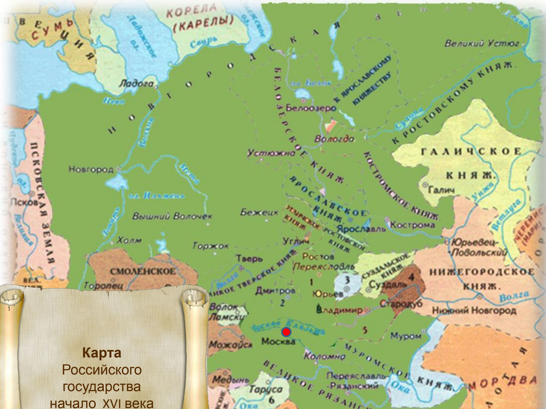
Карта Российского государства начало XVI века