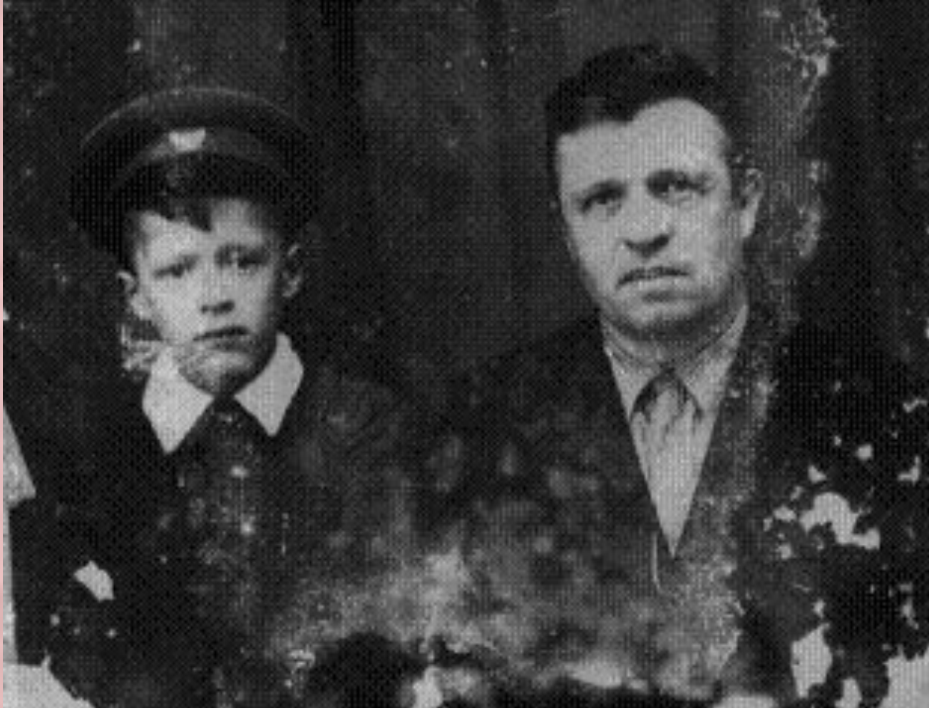
Мои дед и прадед Сысовские 1963 год