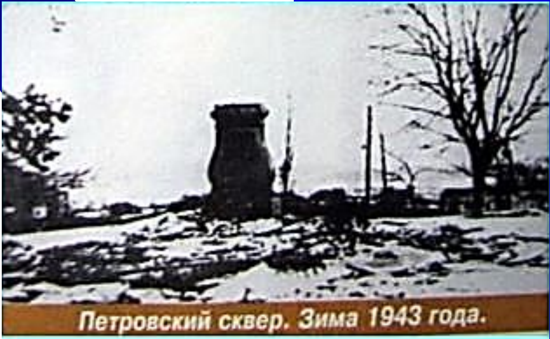
Петровский сквер. Зима 1943 года.

Во время оккупации части города Воронеж фашистами бронзовая статуя Петра I была увезена немцами на переплавку. Долгое время в сквере стоял один постамент.