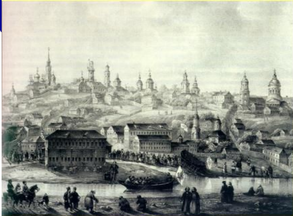
Панорама Воронежа, дворец и цейхгауз Петра I