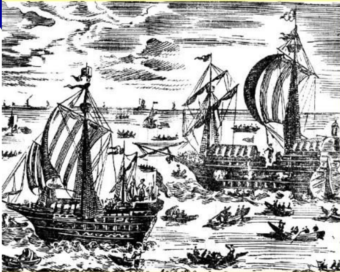
Азовский флот Петра Великого. Старинная гравюра.

Строительство флота было развернуто в г. Воронеже, при впадении р. Вороны в Дон.