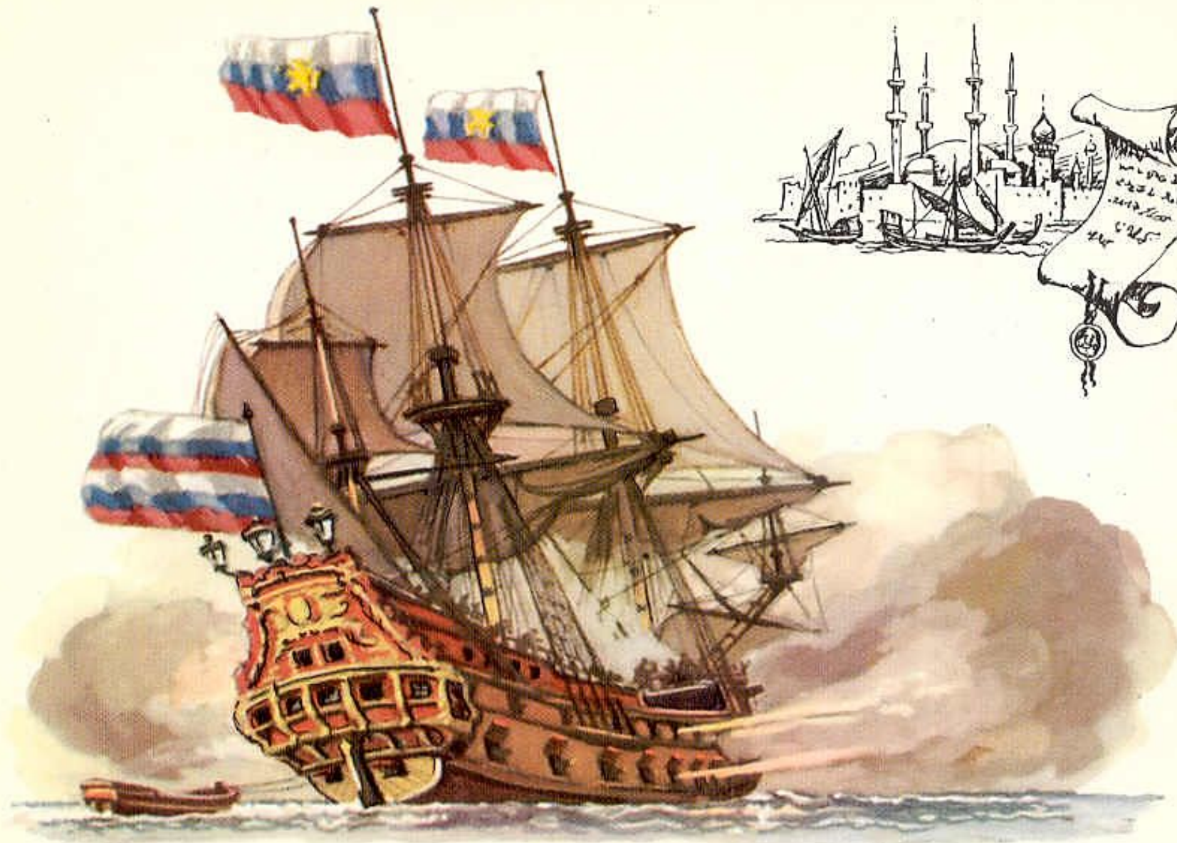
Корабль „Крепость“. И.Родинов. История русского военного флота. Набор открыток.