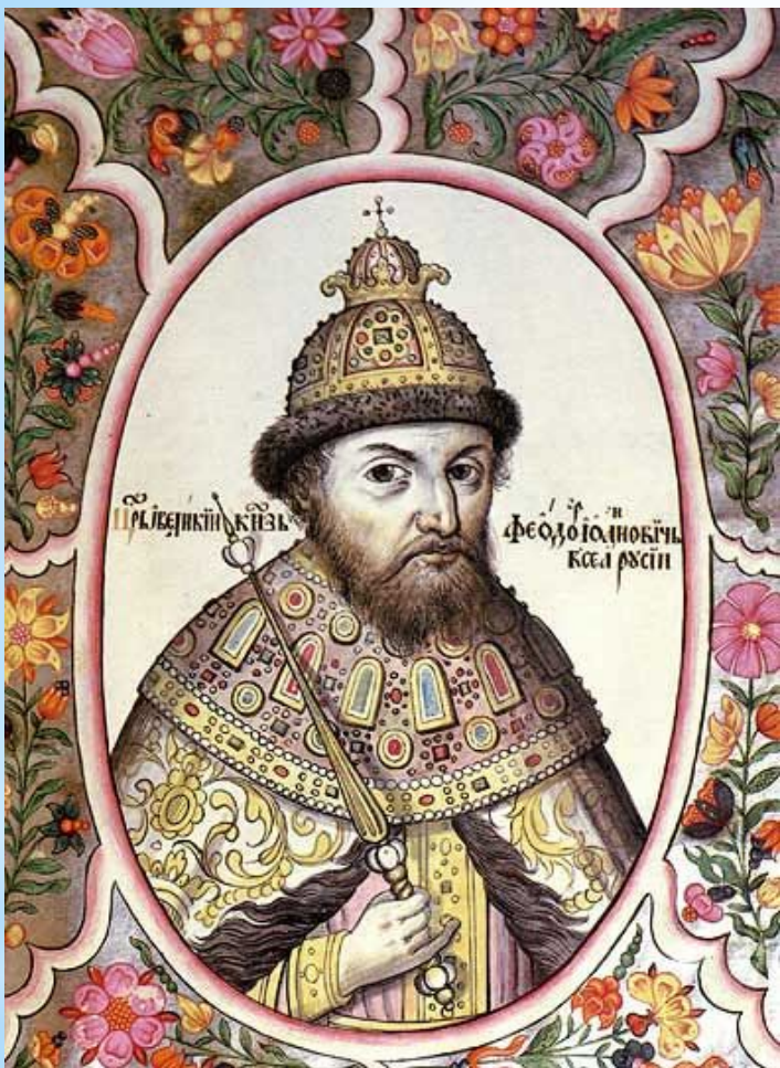
Федор Иванович 1584-1598гг.

В 1584г. после кончины Ивана Грозного на престол взошел его сын Федор Иванович. Федор Иванович был женат на Ирине Годуновой.