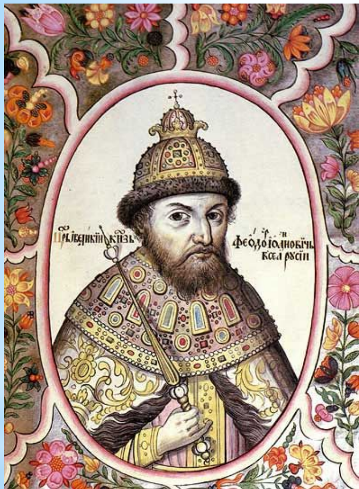
Федор Иванович 1584-1598гг.

Федор Иванович был женат на Ирине Годуновой.