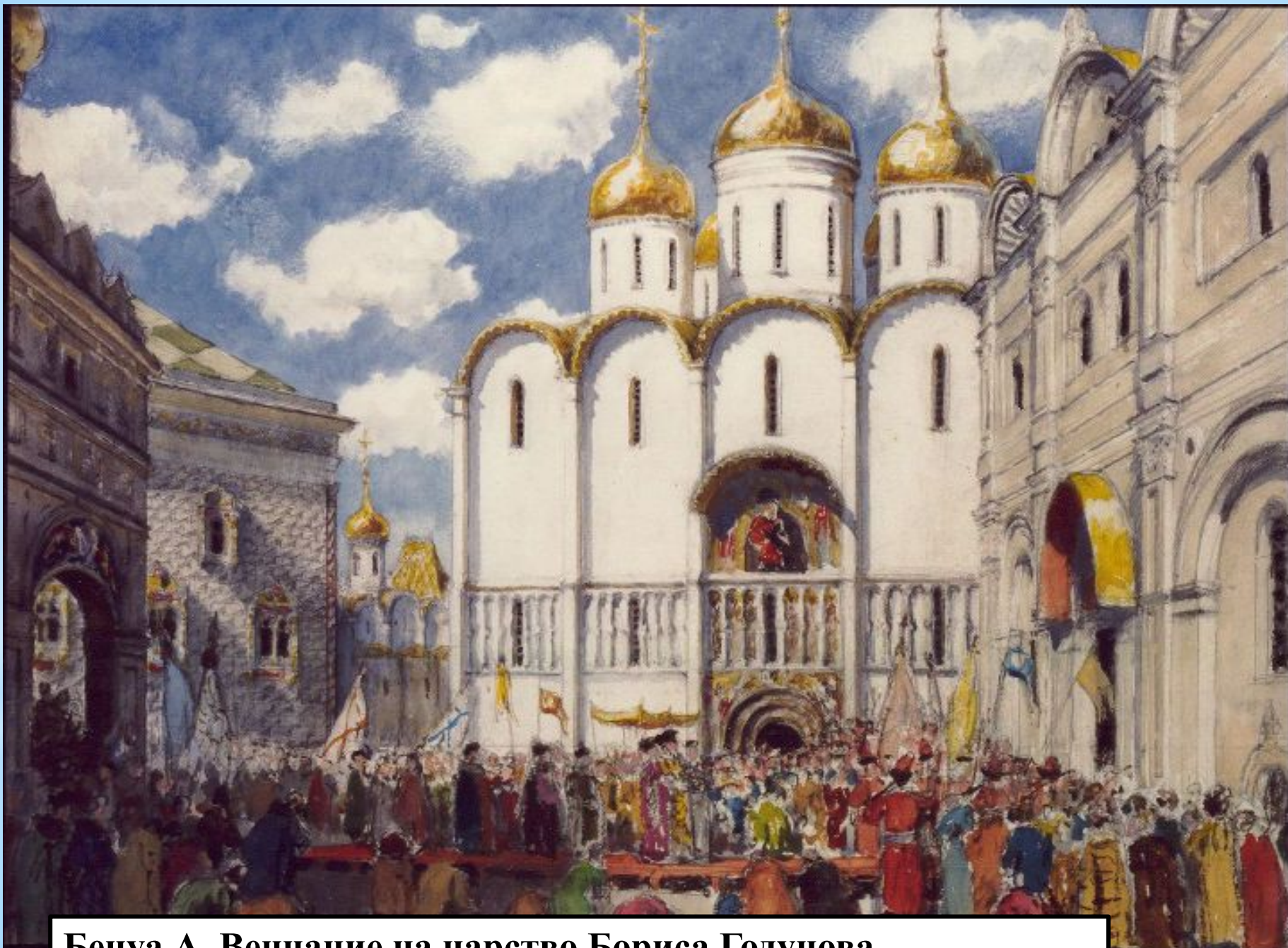
Бенуа А. Венчание на царство Бориса Годунова