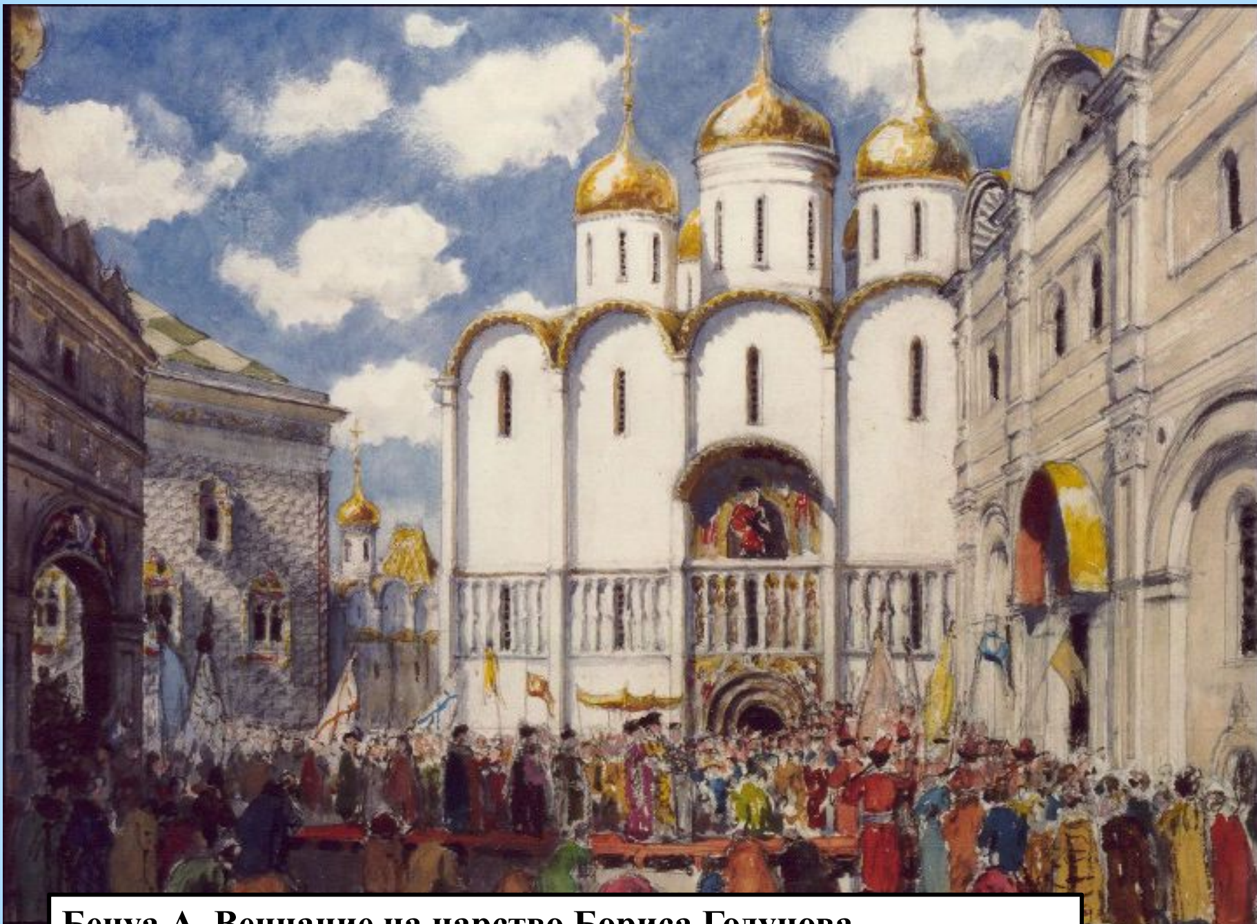
Бенуа А. Венчание на царство Бориса Годунова