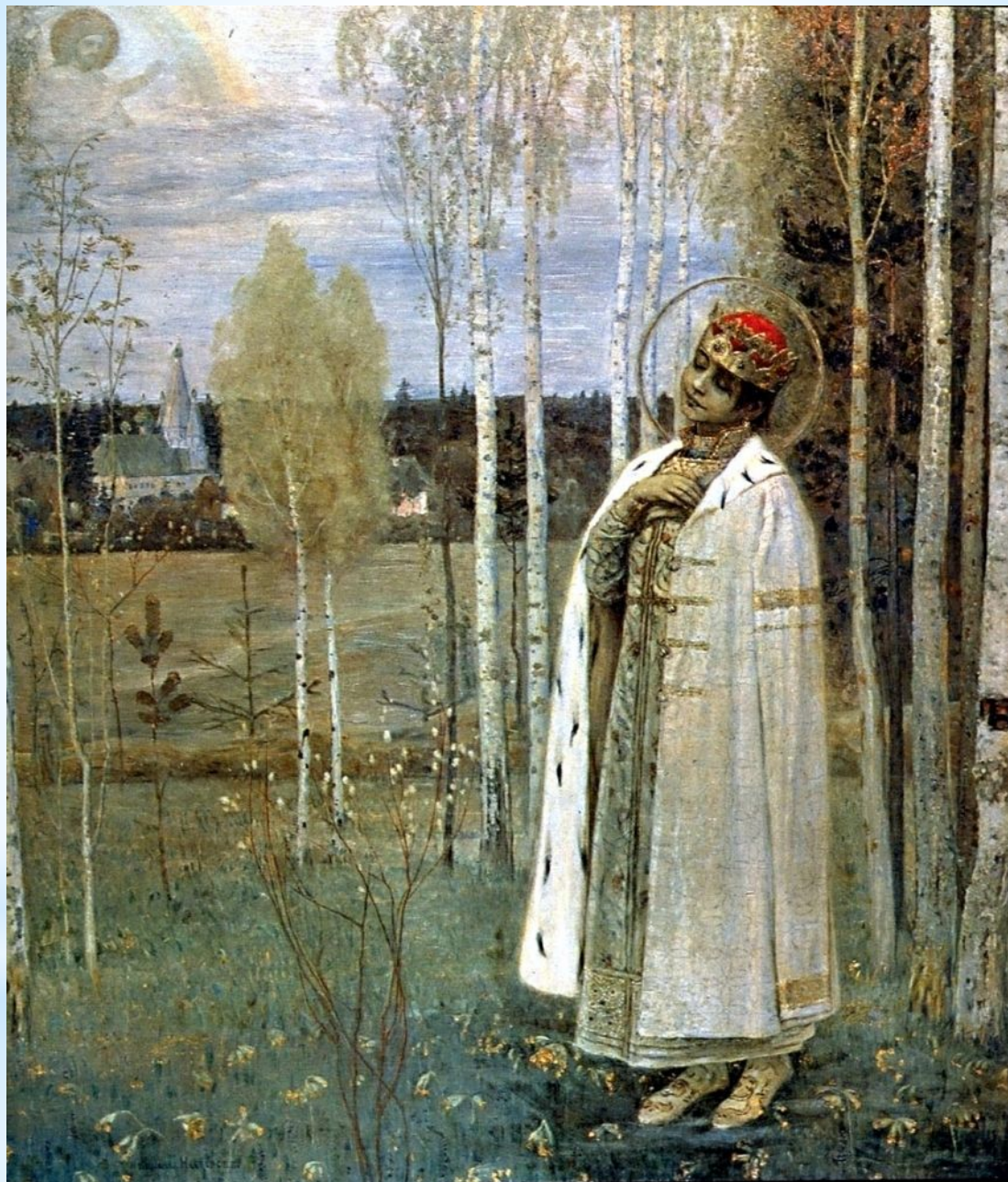
Нестеров М. Царевич Дмитрий