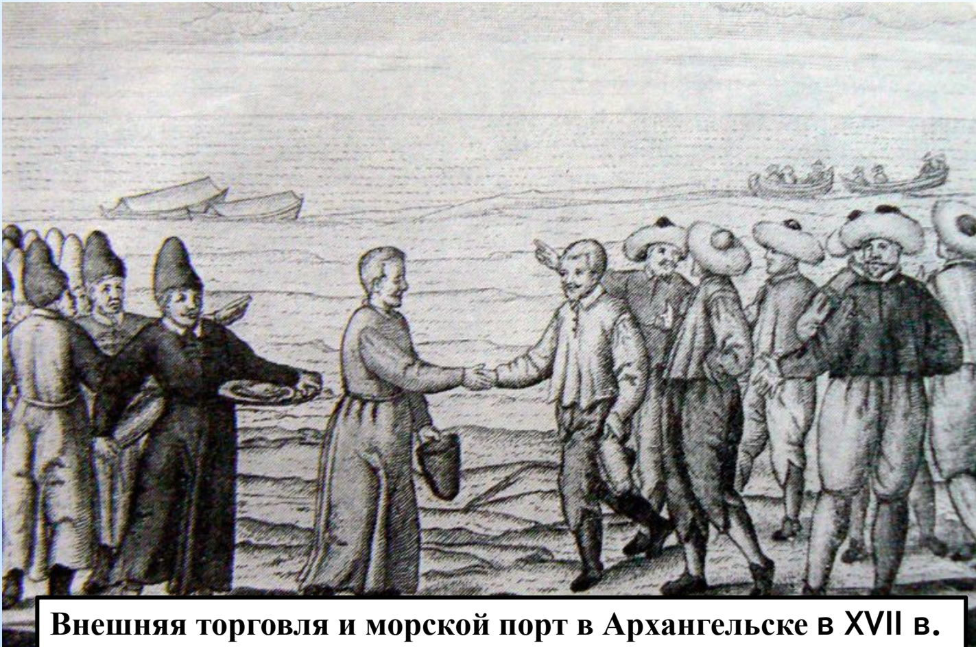
Внешняя торговля и морской порт в Архангельске в XVII в.

Составьте план к разделу параграфа. Стр.92-93