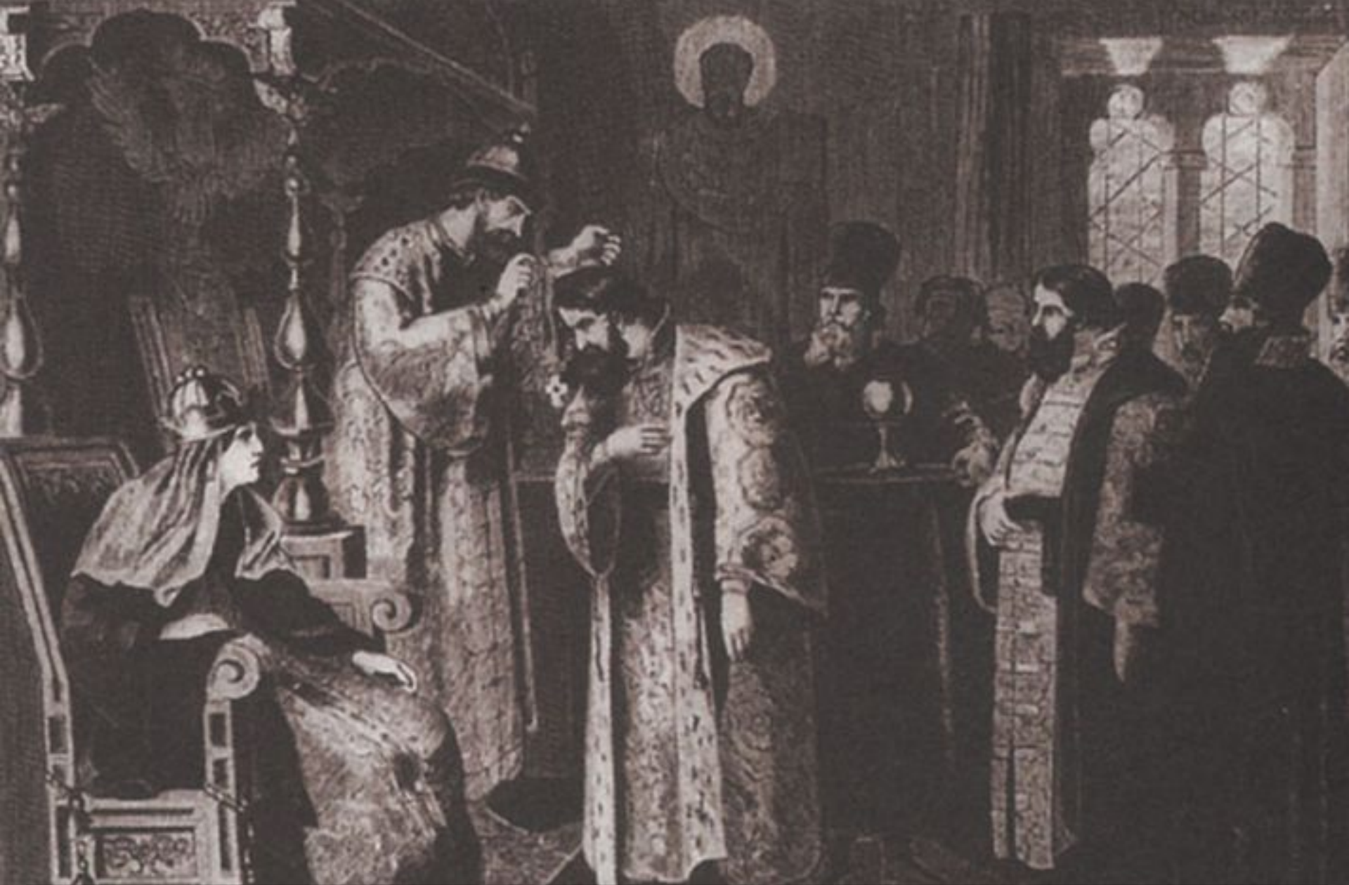
А.Кившенко "Царь Федор Иоаннович надевает на Бориса Годунова золотую цепь"