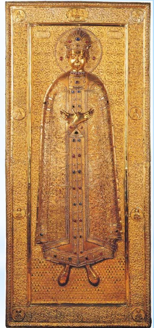
Крышка раки для хранения мощей царевича Дмитрия