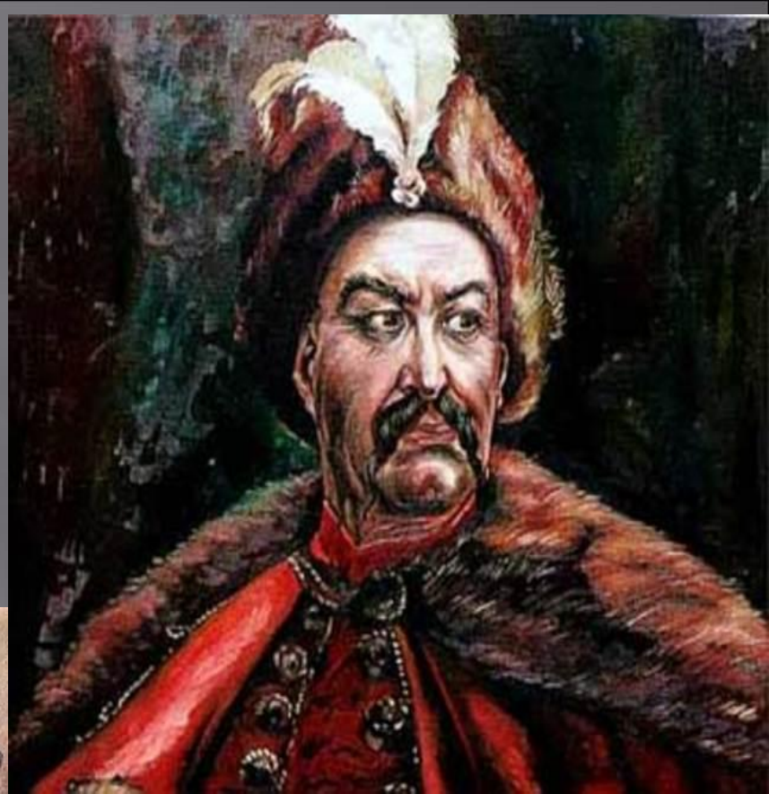
Гетман Богдан Хмельницкий