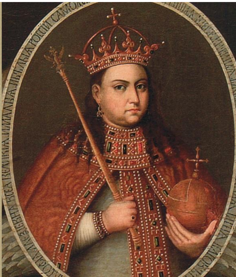
Софья Алексеевна (1682-1689 гг.)