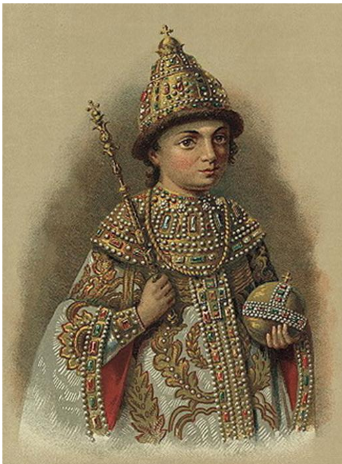
Петр I Алексеевич (1682-1725 гг.)