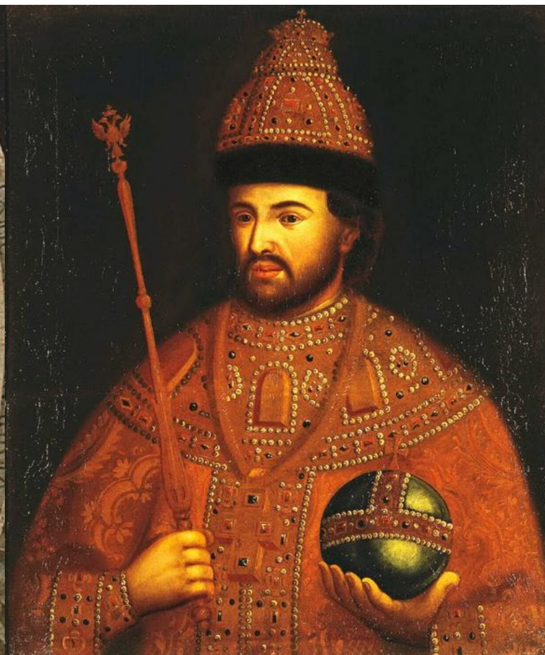
Иван V Алексеевич (1682-1696 гг.)