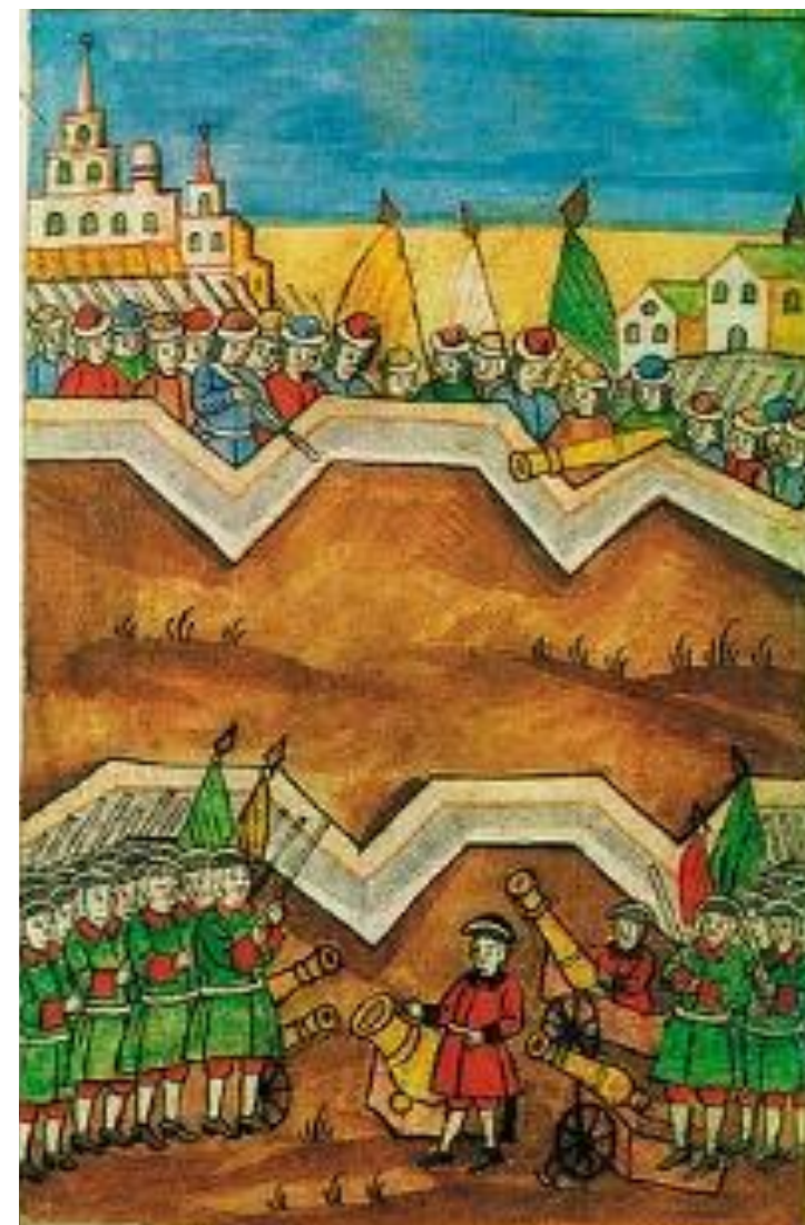
«Потешные войска» – Семеновский и Преображенский полки