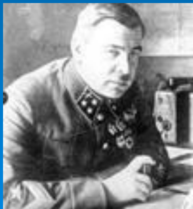
Иван Степанович Конев.