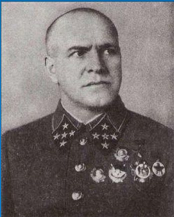
Георгий Константинович Жуков