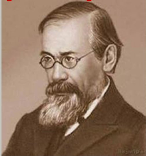
Историк Ключевский В.О