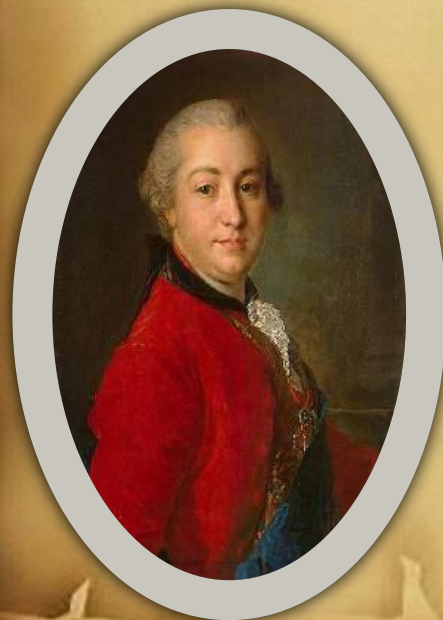
И. И. Шувалов