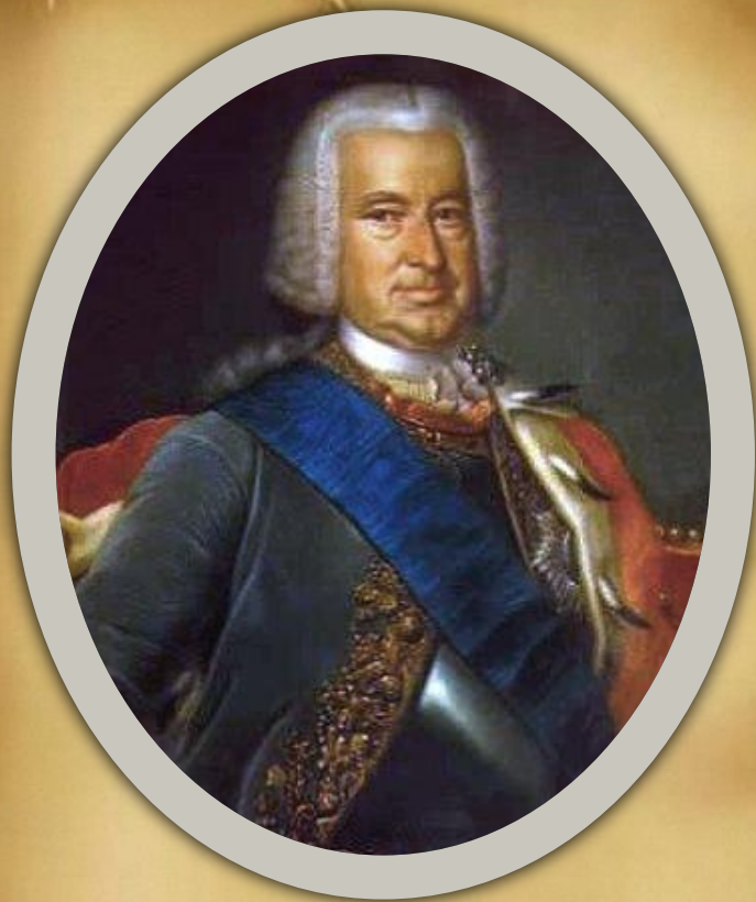
А. И. Остерман