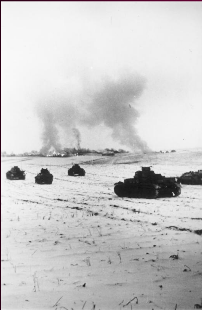
Bild 183-B17220 1.25. November 1941

5–6 декабря Красная армия нанесла контрудар. В результате немцы потеряли 38 дивизий, они были отброшены от Москвы на 250 км.