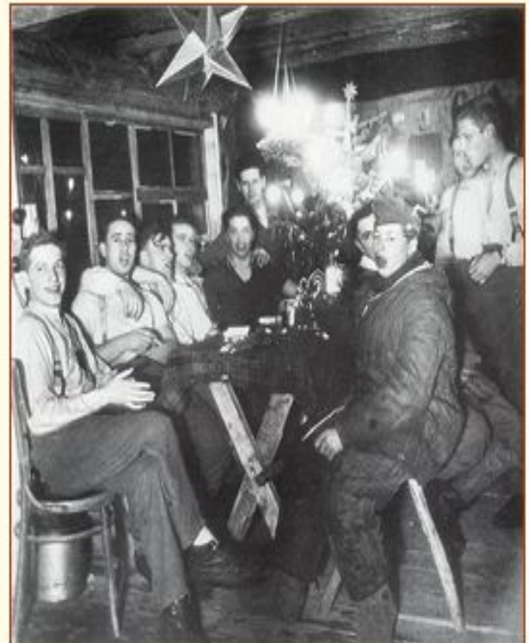
Центральный фронт, 1942 г.