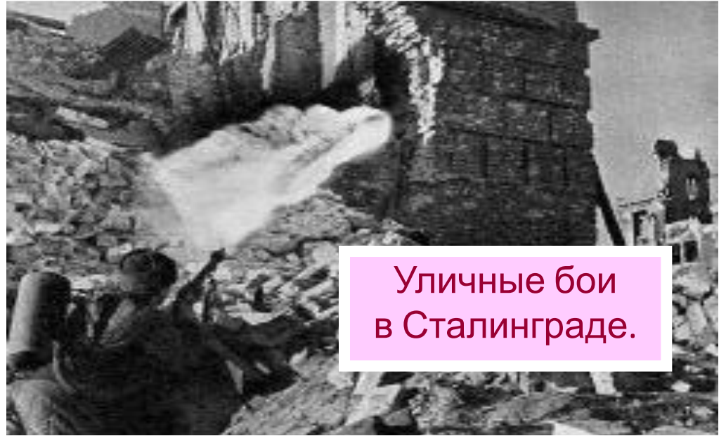
Уличные бои в Сталинграде.

Летом 1942 г. немцы заняли Ростов-на-Дону и через несколько дней вышли к Кавказскому хребту, но дойти до нефти Грозного и Баку им не позволили советские солдаты. В окт. Жуков и Василевский разработали план контрудара под Сталинградом-«Уран». К югу и к северу от города были тайно переброшены многочисленные резервы и 19 нояб. 1942 г. Красная армия нанесла удар. 23 нояб. советские части встретились в районе г. Калач.