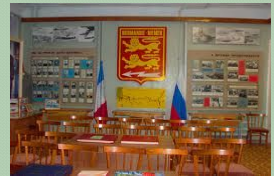
Музей школы № 29