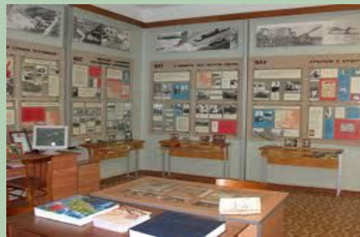
Музей на территории аэродрома Северный