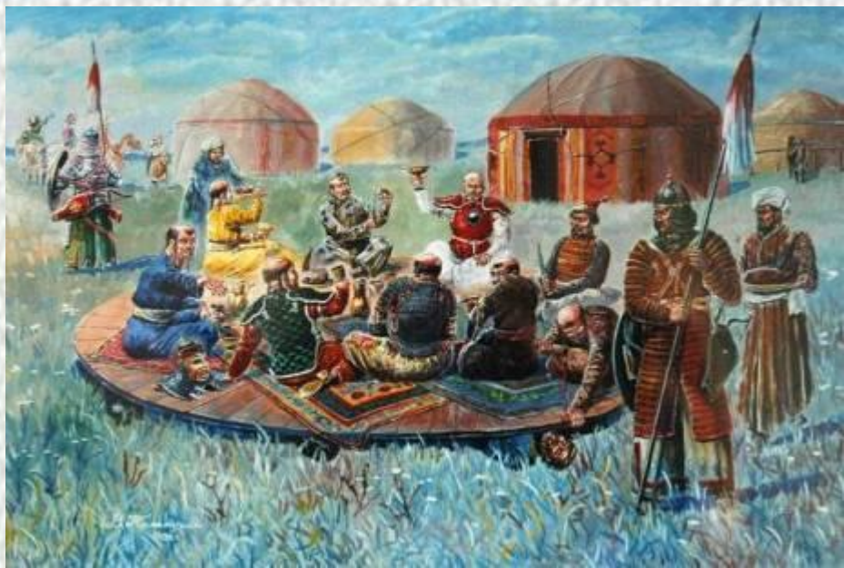
Поражение на реке Калке.