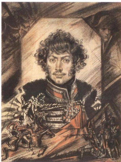
Александр Никитич Сеславин

В районе Можайска и южнее действовал отряд полковника И.М.Вадбольского. Между Боровском и Москвой дороги контролировались отрядом капитана А.Н.Сеславина. На Серпуховскую дорогу был выслан полковник Н.Д.Кудашив. На Рязанской дороге находился отряд полковника И.Е.Ефремова. С севера Москву блокировал крупный отряд Ф.Ф.Винценгероде.