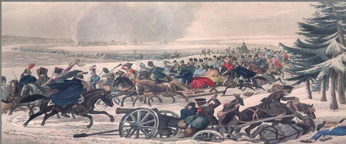
Отступление французов из России. Гравюра первой четверти 19 века. Москва, Государственный исторический музей.

Народный характер войны ярче всего проявился в партизанском движении, которое сыграло стратегическую роль в победе России. Подъем народных масс на борьбу с врагом обуславливался тем, что война для русских людей носила справедливый, оборонительный характер; крестьяне боролись за национальную независимость своей Родины. Они создавали партизанские отряды и развертывали вооруженную борьбу против захватчиков. Своей мужественной и самоотверженной борьбой крестьяне оказали существенную помощь в разгроме врага. В 1812 году русский народ проявил свойственные ему стойкость, выдержку, самоотверженность и героизм!